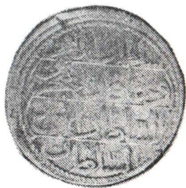
Fig. 5 Monede din tezaurul de la Suraia. Fig. 5 Monnaies du tr sor à Suraia.