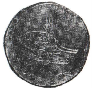
Fig. 4 Minede din tezaurul de la Suraia. Fig. 4 Monnaies du trésor à Suraia.