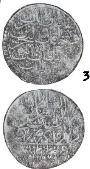
Fig. 1 Monede din tezaurul de la Suraia (1, 3), vasul în care a fost descoperit tezaurul (2). Fig. 1 Monnaies du trésor à Suraia (1, 3), le vaisseau où a été découvert le trésor (2).