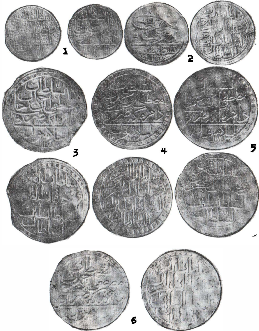
Fig. 3 Monede din tezaurul de la Suraia. Fig. 3 Monnaies du trésor à Suraia.