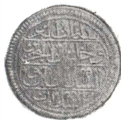
Fig. 2 Monede din tezaurul de la Suraia. Fig. 2 Monnaies du trésor à Suraia.