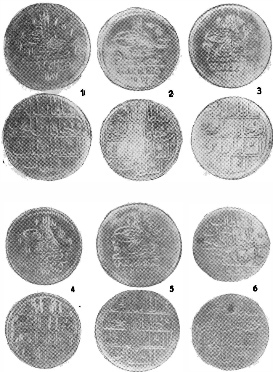
Fig. 3. Monede din tezaurul de la Văleni — Străoane.