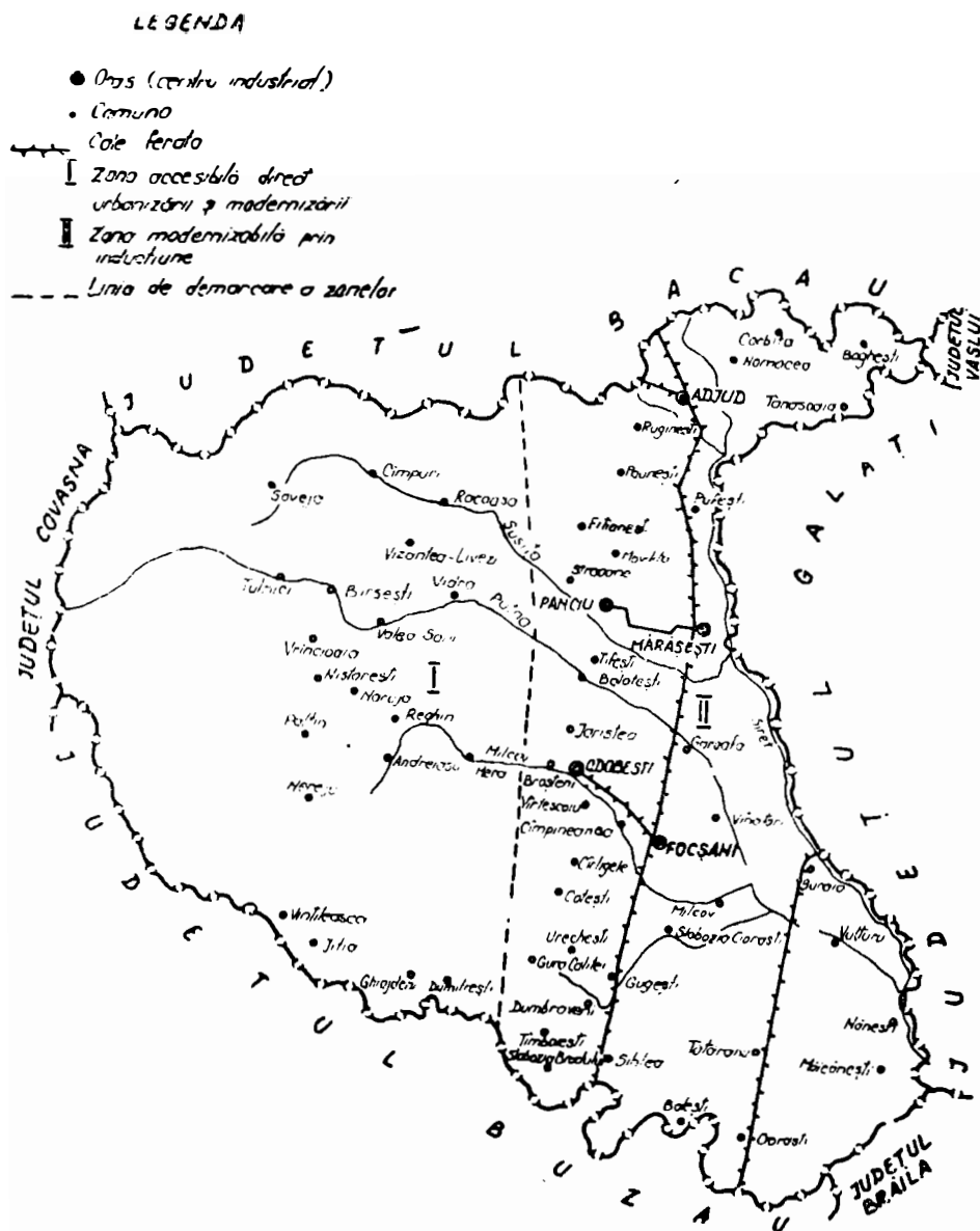
Fig. 3. Cele două zone, diferit modernizabile, ale județului Vrancea.