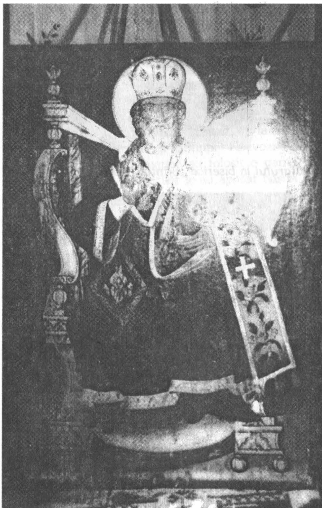
Icoană pe lemn „Sfântul Nicolae” — 1791