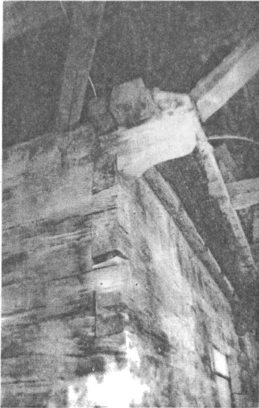
Sistemul de prindere al bânelor