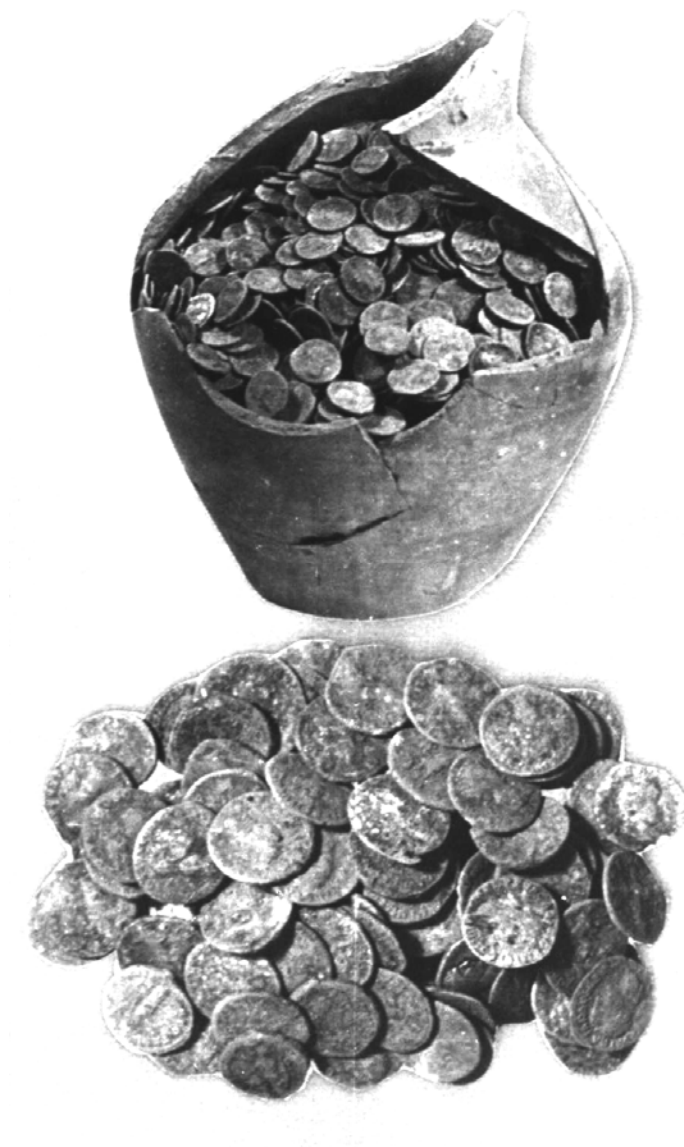
Fig. 1. Măgura-Bacău. Vasul cu monede și un lot de denari din tezaur