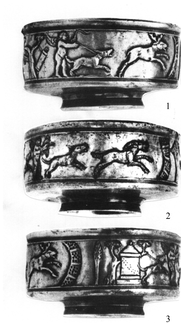
Fig. 3 Muncelul de Sus. Cupa nr. 2, cu decorul desfășurat (1-3)