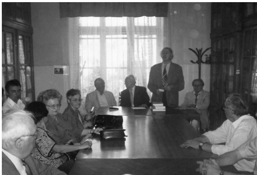
Aspect de la festivitatea de la Institutul de Arheologie din Iași, din 17 mai 2007