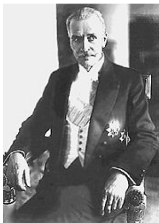
Ignacy Mościcki (1864-1964)