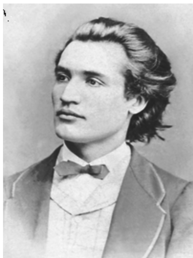
M. Eminescu (1850-1889)