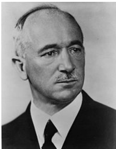
Edvard Beneš (1884-1948)