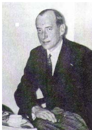
Colonelul Józef Beck (1894-1944)

În același an, Józef Piłsudski a inaugurat noul regim politic denumit „Sanacja” („curățenia”). Mareșalul susținea că „țara nu putea fi condusă «cu biciul»”, iar obiectivul „era nu de a schimba sistemul politic, ci de a-l curăța” 27 . Totodată, Józef Piłsudski s-a declarat hotărât să țină armata departe de mâinile politicianilor, să stabilizeze economia, să pună capăt nedreptăților sociale, să unească pe toți cetățenii polonezi sub semnul respectului față de stat, făcând din Polonia o mare putere europeană 28 . Mareșalul și-a creat propriul partid – Blocul fără de partide – care, având sprijinul marelui capital și al ofițerilor superiori, a concentrat, de fapt, puterea în mâinile sale.