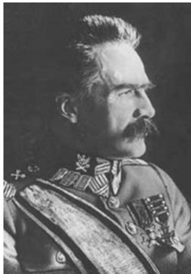
Mareșalul Józef Piłsudski (1867-1936)

Refacerea statului independent polonez a coincis, pe plan politic, cu apariția unui număr însemnat de partide 22 , precum: Uniunea Populară Națională (UPN) s-a constituit prin unirea Partidului Național Democrat cu unele grupări mai mici, membrii grupării fiind denumiți „endek” (de la „ND”), iar mișcarea politică, condusă de Roman Dmowski, s-a numit „Endecja”; Uniunea Creștin Națională (UCN), care s-a bucurat de sprijin în regiunile Poznań și Pomerania; Partidul Național Drept, condus de Józef Radziwiłł; Partidul Socialist Polon; Partidul Comunist Muncitoresc; Partidele Popular Polon și Național Țărănesc care se adresau țăranilor, ca și formațiunea „Piast”.