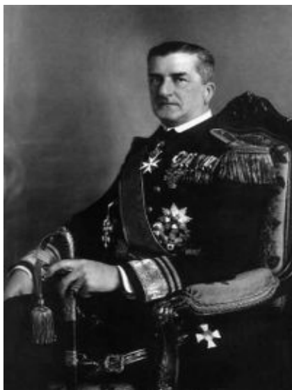
Amiralul Miklós Horthy (1868-1957), Guvernator al Ungariei (1920-1944)

În politica externă , domeniu în care obiectivul fundamental l-a constituit apropierea de Rusia, Béla Kun a încercat prin toate mijloacele aflate la dispoziție să liniștească susceptibilitățile Aliaților pentru a preîntâmpina o