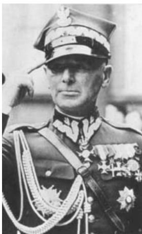
Mareșalul Edward Rydz-Śmigły (1886-1941)