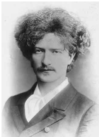
Ignacy Jan Paderewski (1860-1941)