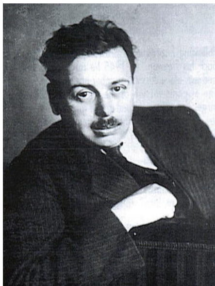
Béla Cohen (alias Béla Kun) (1886-1941)

pe Béla Kun, și care a propovăduit o serie de obiective și reforme 102 : distrugerea vechii ordini de stat; puterea politică a trecut în mâinile sfaturilor, iar conducerea centrală în ale Consiliului Revoluționar de Guvernământ (Președintele acestui Consiliu a fost ales Sándor Garbai, dar puterea efectivă o deținea comunistul Béla Kun, comisar al poporului pentru afacerile externe); biserica a fost separată de stat; băncile au fost trecute în proprietatea statului și depozitele confiscate; întreprinderile cu mai mult de 20 angajați au fost naționalizate; moșiile mai mari de 100 de iugăre (un iugăr = 0,576 ha) au fost trecute în proprietatea statului și gestionate prin gospodăriile de stat; Armata Roșie a luat locul jandarmeriei, iar detașamentele înarmate, numite „Băieții lui Lenin”, rechiziționau case, arestau „elementele potrivnice” și pe „capitaliști și aristocrați”.