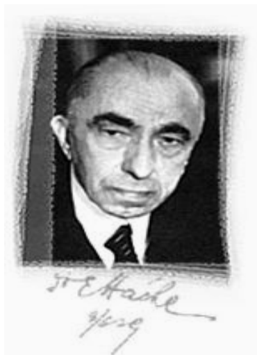
Emil Hácha (1872-1945), Președintele Cehoslovaciei (30.11.1938-15.03.1939)

În decembrie 1919, au început, la Praga și la Belgrad, convorbiri bilaterale pe tema unei convenții defensive. La 5 ianuarie 1920, Beneš i-a scris premierului român Alexandru Vaida-Voevod, propunându-i o colaborare în trei relativ la combaterea pericolului revizionist ungar, comun pentru toți. Astfel, prin tratatul de alianță defensivă cehoslovaco-iugoslav din 23 aprilie 1921 și tratatul româno-iugoslav din 7 iunie 1921 s-au pus bazele Micii Înțelegeri – organism pentru apărarea și promovarea intereselor celor trei țări în plan internațional 71 .