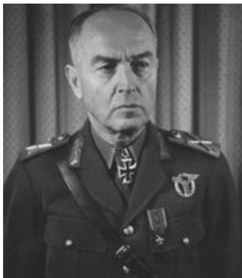
Ion Antonescu (1882-1946)