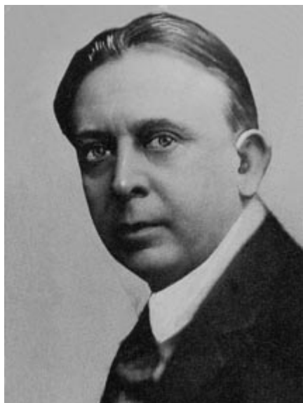
Octavian Goga (1881-1938)