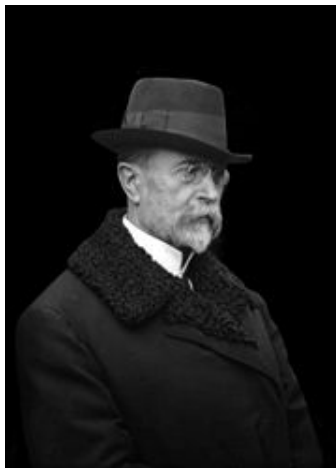
Tomáš Garrigue Masaryk (1850-1937)

Încă de la început, noul stat și autoritățile de la Praga s-au confruntat cu probleme grave care i-au pus în pericol existența. Germanii rămași între frontierele cehoslovace au încercat crearea a trei republici în Boemia, Moravia și Silezia cehoslovacă și au cerut la 29 octombrie alipirea la Austria. A fost nevoie de o intervenție în forță pentru a stopa ruptura. În martie 1919 a trebuit reprimată rebeliunea germanilor, pe timpul căreia 52 germani au fost uciși 61 . Slovacia s-a confruntat și ea cu două intervenții militare maghiare. În noiembrie 1918, trupe maghiare au pătruns în regiune încercând să blocheze intrarea unităților cehe. Politica Budapestei a fost descurajată de intervenția Aliatilor. În primăvara anului 1919, regimul bolșevic condus de Béla Kun și-a trimis trupele în Slovacia și Rutenia, contând și pe sprijinul minorității maghiare. La 16 iunie 1919 s-a proclamat Republica Sovietică Slovacă, dar a rezistat numai două săptămâni. Aliații din Occident au aprobat acțiunile administrative, politice și militare întreprinse de Cehoslovacia atât împotriva germanilor sudeți cât și împotriva bolșevicilor lui Béla Kun.