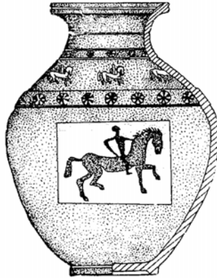
Fig.1. Chiup, varianta 1a, descoperit la Zimnicea, (apud Sorin Nemeti)