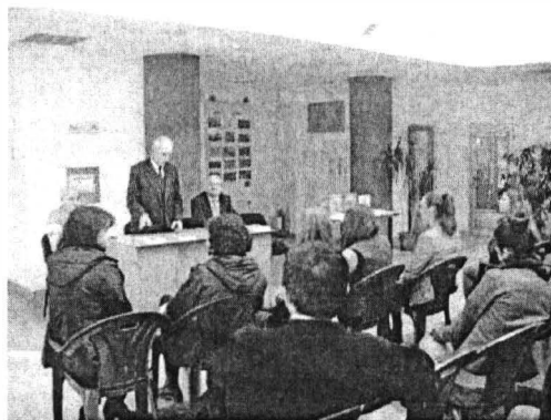
Aspect de la prezentarea lucrării la Muzeul de Istorie Onești

În încheiere, putem concluziona că, apariția volumului de față, reprezintă o reușită a distinsului profesor și arheolog băcăuan, ea aducând în atenția specialiștilor și a publicului larg istoria unei perioade mult discutată și controversată din procesul de formare a poporului român, respectiv perioada secolelor V-VII.