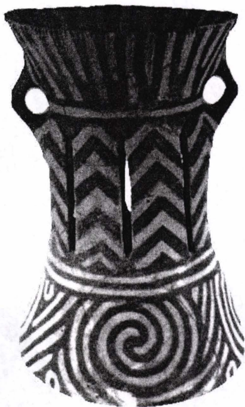
Fig. 4. Drăgușeni, Ostrov, Botoșani Cucuteni A, 36 cm înălțime