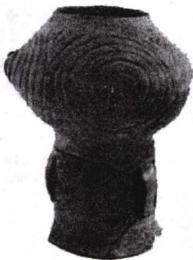
Fig. 3. Mitoc, Botoșani