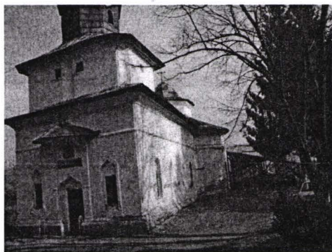
Biserica Sfânta Troiță din Dedulești.

Dumitru/Dedu Dedulescu și-a stabilit curtea la Gura Babei, azi Dedulești, sat în comuna Topliceni, județul Buzău, unde ctitorește, în 1620, biserica cu hramul Sfânta Treime/Sfânta Troiță , din 1791 are și hramul Pogorârea Sfântului Duh , în jurul căreia a înființat un schit de călugări. Pisania pusă desupra intrării în 1834 menționează că „această biserică ce se prăznuiește și se cinstește hramul Sfânta Troiță, au fost zidită din început până la leatu 7128/1619-1620 de un răposat Dedu Dedu<les>cu”. La ctitorirea acesteia, Dedu postelnic (?) a înzestrat-o cu mori de apă, pământuri, sate și robi țigani și a închinat-o mănăstirii Cațichi din Ianina/Epir, Grecia. Conform descoperirilor