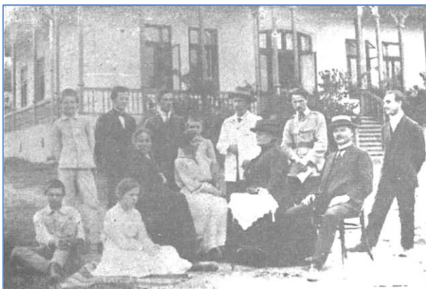
1917 – Casa Bulbuc din Bârlad. În jurul poetului A. Vlahuță: Victor Ion Popa, Eugen Bulbuc, frații Virgil și Iuliu Nițulescu.