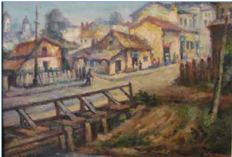
Prăvăliile situate de-o parte și de alta a vechiului Pod al Pescăriei din Bârlad. Pictură de Mihai Adamiu.