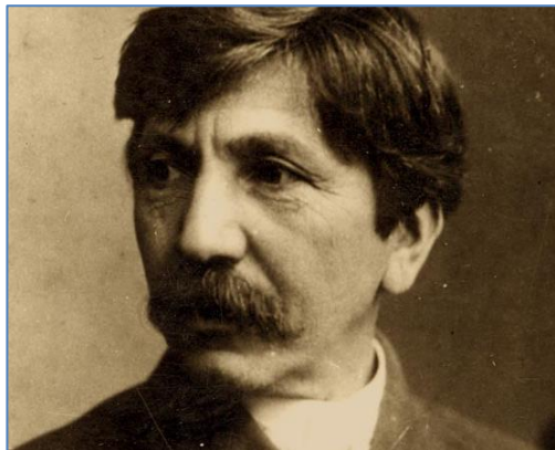
Alexandru Vlahuță, primul președinte de onoare al Academiei Bârlădene, refugiat la Bârlad în toamna anului 1917, în casa Bulbuc.