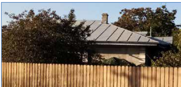
Casa învățătorului Ion Popa, de pe str. Al. I. Cuza nr. 15 din Bârlad. Imagini actuale.