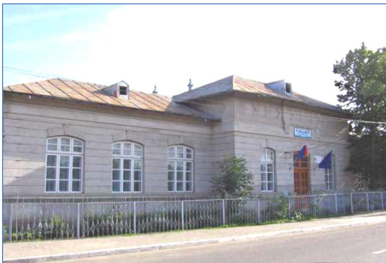
Școala de băieți din incinta Bisericii „Sf. Gheorghe”, azi Școala Gimnazială „Principesa Elena Bibescu”. Imagine actuală.