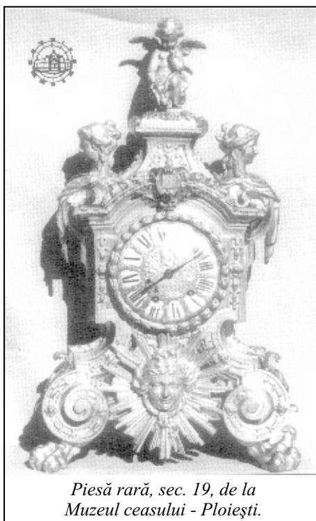
Piesă rară, sec. 19, de la Muzeul ceasului - Ploiești.

a măsurat momentele cruciale din istoria neamului nostru, reflectând locul unde visele, năzuințele și frământările poporului nostru se elaborau, se ordonau și căpătau viață în timp și pentru viitorul timp, măsurate cu exactitate: prima unire se înfăptuise sub un singur cârmuitor, Al. I. Cuza, iar ceasul astronomic din cancelaria sa indica atunci 24 ianuarie 1859. Acest