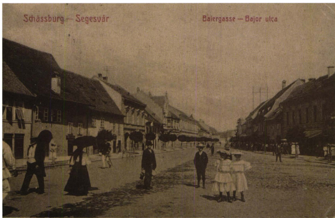
Foto 7 : Baiergasse, azi strada 1 Decembrie 1918, la începutul sec.XX