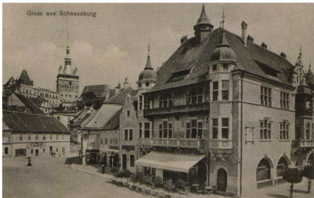
Foto 6 : Casa Meșteșugarilor-la parter Café Martini, începutul secolului XX