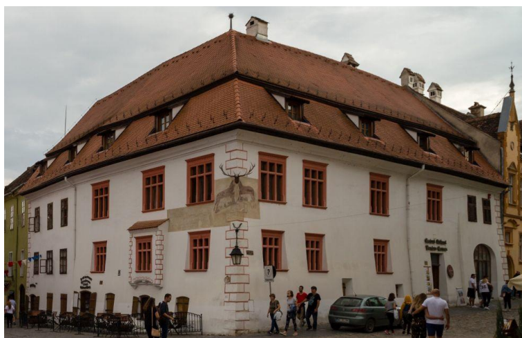
Fig. 1: Casa cu Cerb