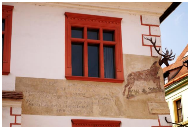
Fig 2: Inscripția latină de pe casa cu cerb

în anul lui Christos 1693 ziua 10 iunie la vârsta propriuzisă 55 a hotărât.