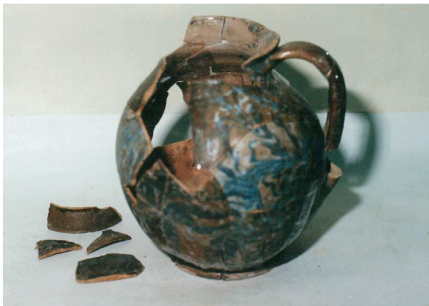
Cana habană în timpul restaurării.