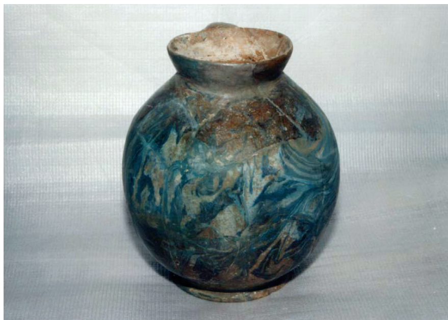
Cana habană după restaurare.