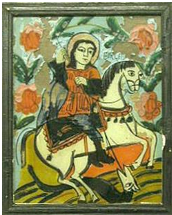
Nr. inv. 2246 – Sfântul Gheorghe