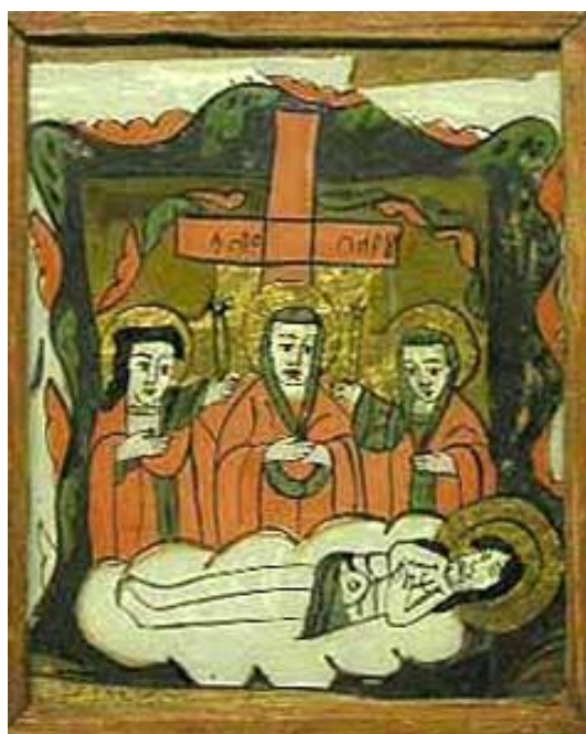
Nr. Inv. 2273 – Plângerea Lui Isus