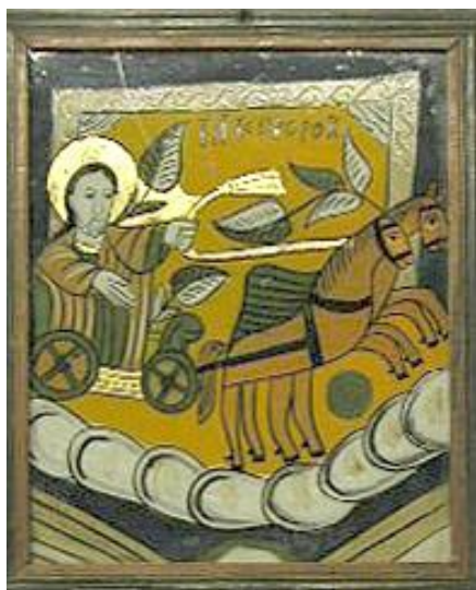
Nr. Inv. 2226 - Sfântul Ilie Prorocul