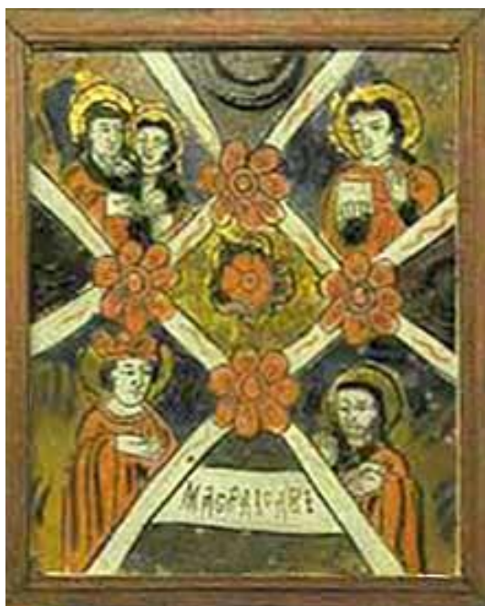
Nr. Inv. 2262 – Masa Raiului