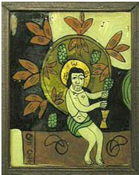
Nr. Inv. 2280 – Isus cu vița de vie