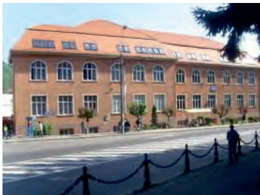
Școala gimnazială „Radu Popa” Sighișoara