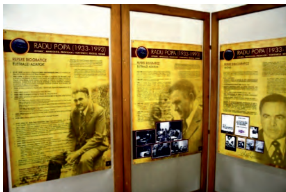
Școala „Radu Popa” - interior