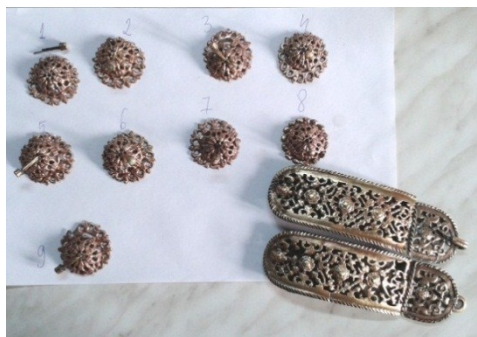
Detaliu cataramă și butoni după restaurare