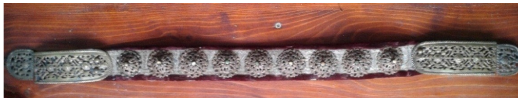
Ansamblu piesă înainte de restaurare