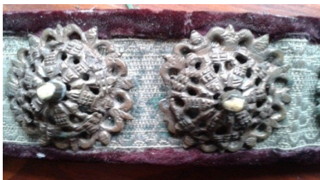
Detaliu butoni înainte de restaurare