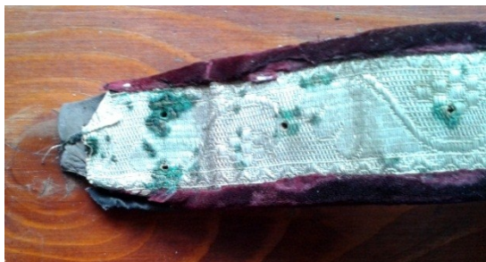
Detaliu pânză înainte de restaurare