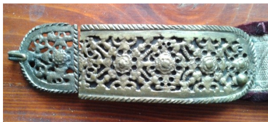
Detaliu cataramă (1) înainte de restaurare