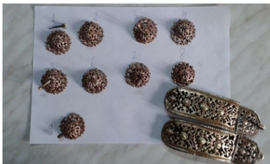
Detaliu butoni după restaurare