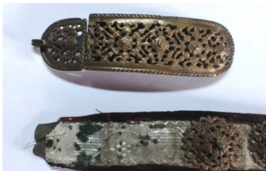
Detaliu cataramă și pânză înainte de restaurare