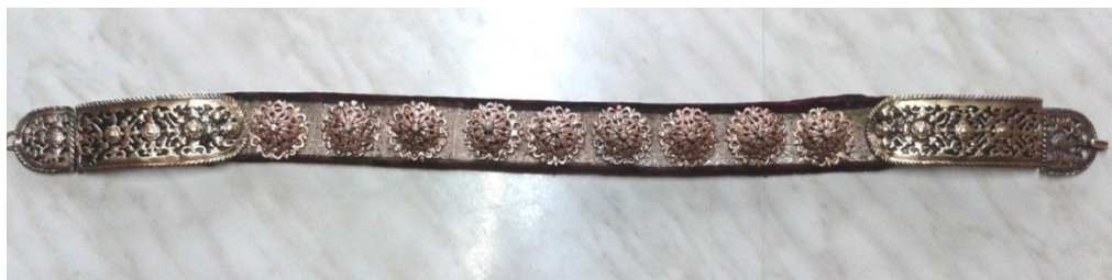
Ansamblu piesă după restaurare