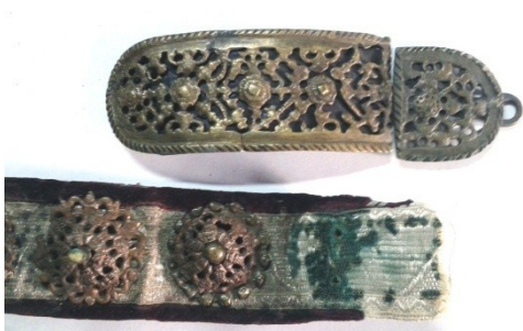
Detaliu cataramă și butoni înainte de restaurare