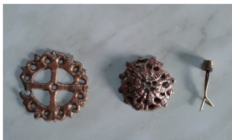
Detaliu buton dezmembrat după restaurare