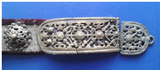
Detaliu cataramă (2) înainte de restaurare