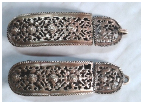
Detaliu cataramă după restaurare