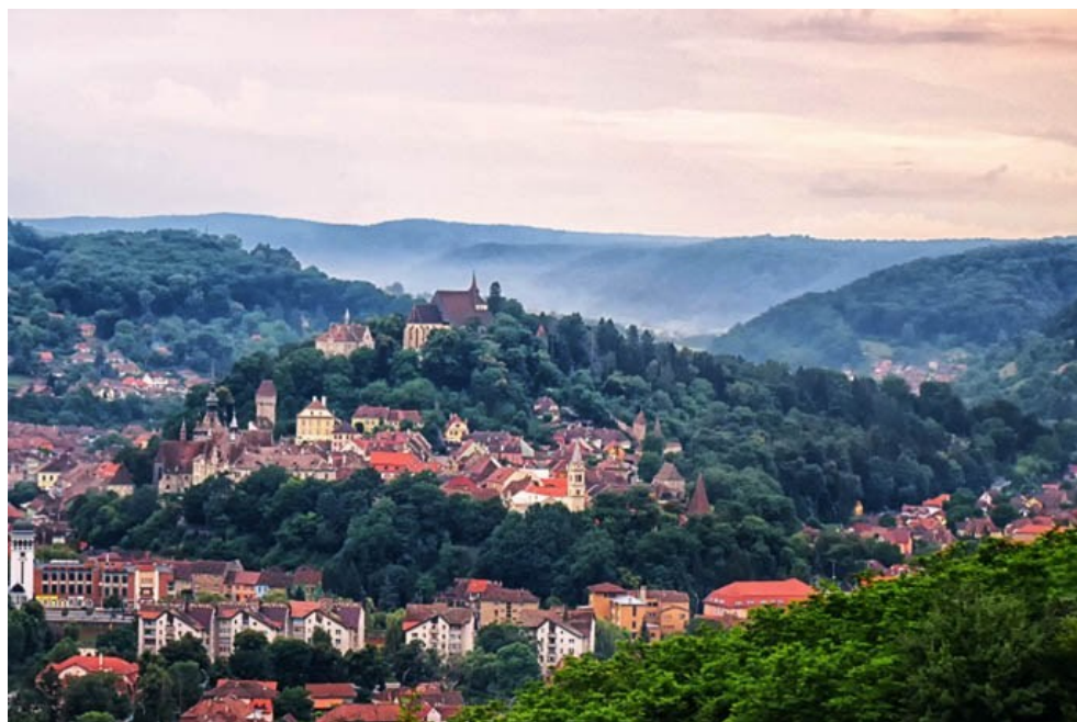
Bijuteria din pădure - Sighișoara contemporană