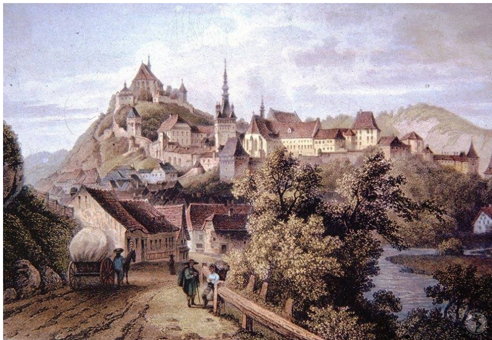
Sighișoara în 1850. Gravură de Ludwig Rohbok