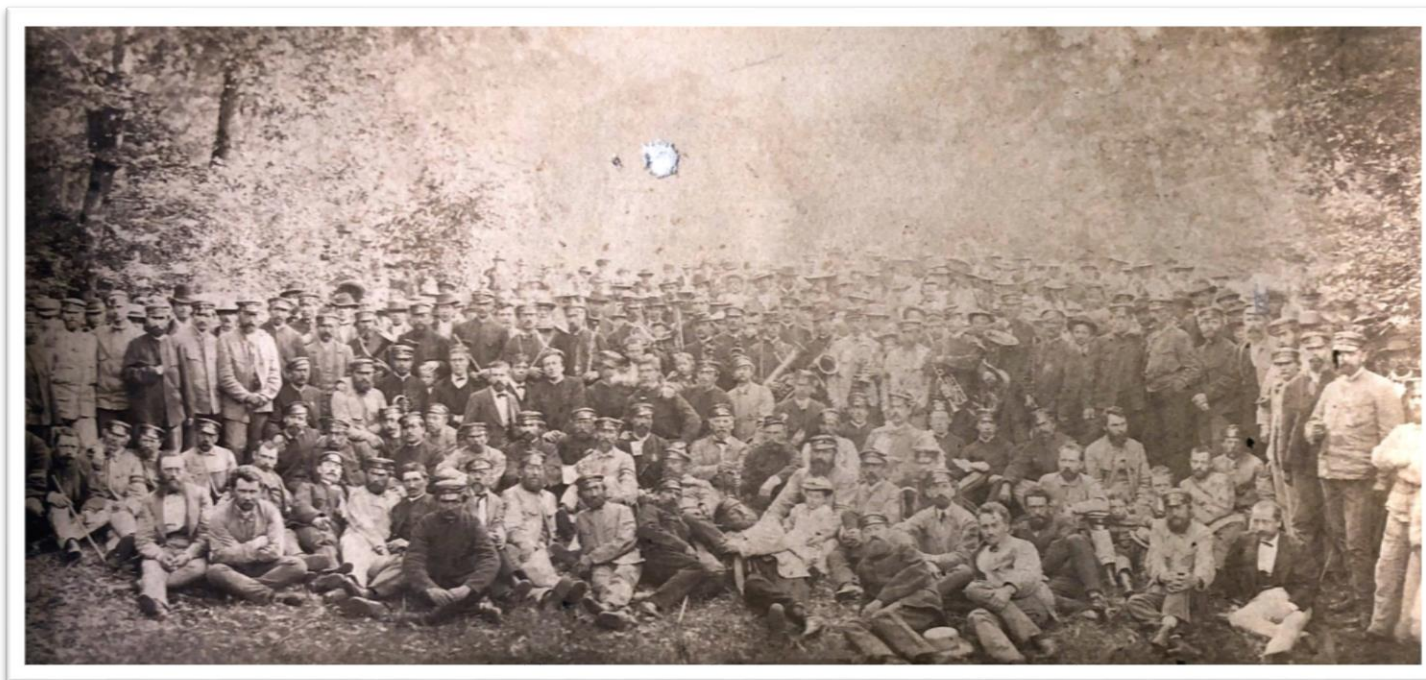
Foto 1. O petrecere la „iarbă verde” a pompierilor voluntari sighișoreni, probabil în anul întemeierii (1873).