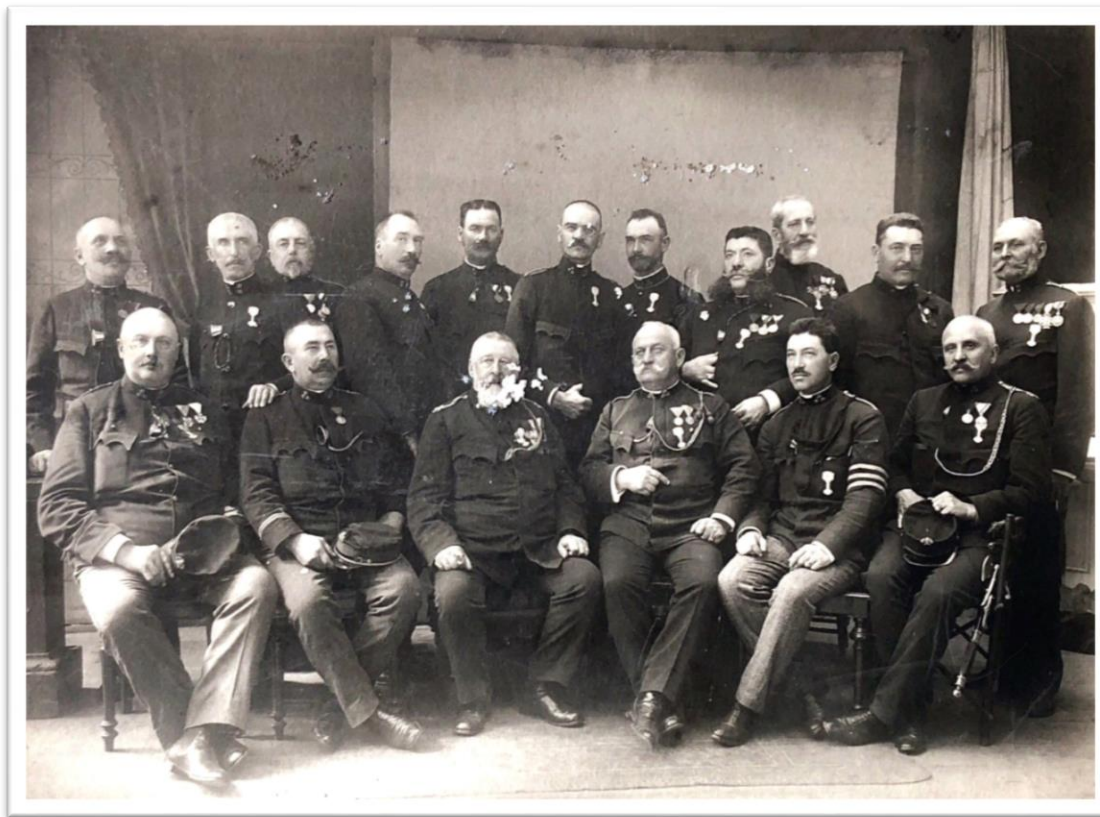
Foto 5. Delegația săsească la Ziua Pompierilor, Leipzig 1913.