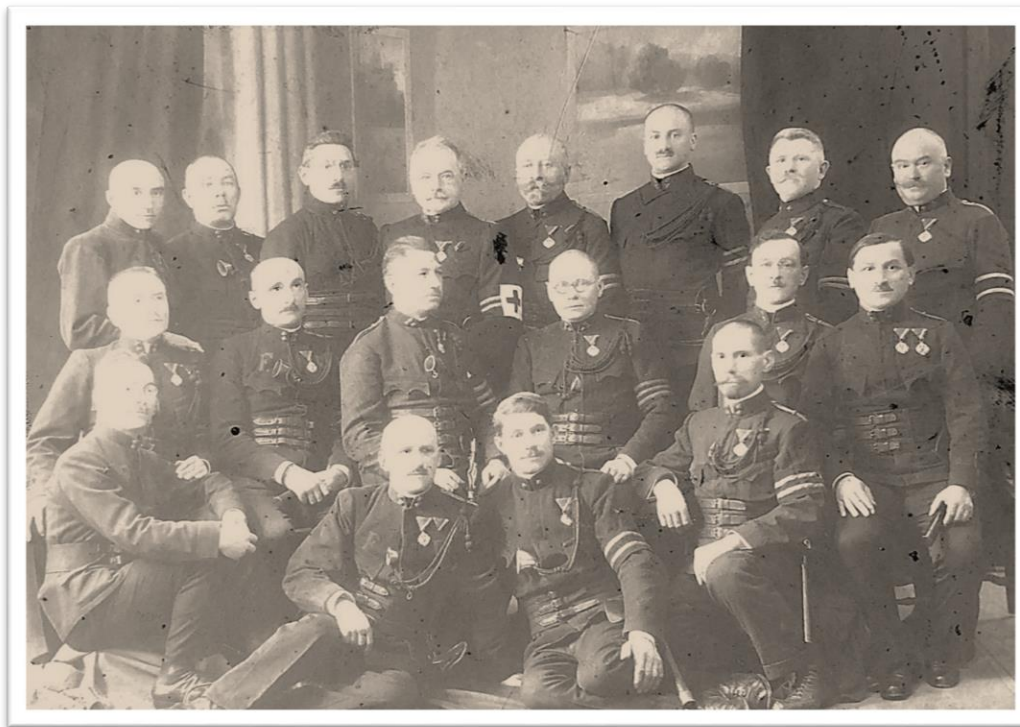
Foto 6. Conducerea pompierilor voluntari sighișoreni la jubileului de 50 de ani din anul 1923.