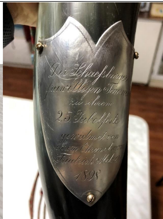
Foto 3-4. Cornul aniversar oferit în semn de recunoștință de către Fr. Meltzer, președintele de onoare al pompierilor voluntari sighișoreni, cu ocazia împlinirii a 25 de ani de la întemeierea Asociației (25 iunie 1898) și textul gravat în limba germană.