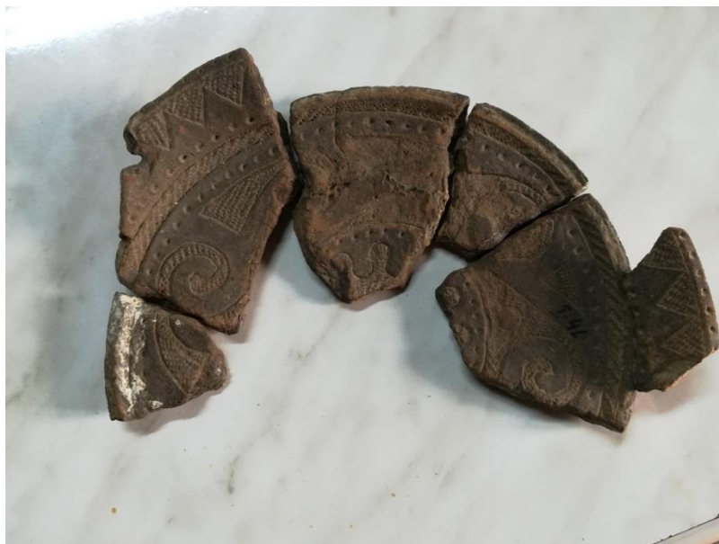
Farfuria înainte de restaurare.