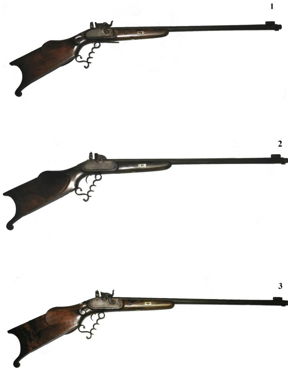
Pl. II. Puști de tir sportiv cu percuție (capsă) din colecția Muzeului de Istorie Sighișoara. Armurier: Daniel Schuster (Hermannstadt/Sibiu). Percussion sporting rifles from the collection of Sighisoara Museum. Armorer: Daniel Schuster (Hermannstadt/Sibiu): 1. nr. inv. 3358; 2. nr. inv. 3371; 3. nr. inv. 3374.