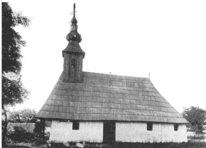
Biserica din Iersig văzută dela sud

Dealungul diametrului arcului, deasupra intrărilor, în firide marcate prin cadre de lemn, cei 12 apostoli având în mijloc pe Isus, iar dealungul arcului alte 13 figuri (proroci) în medalion, cu Isus în mijloc.