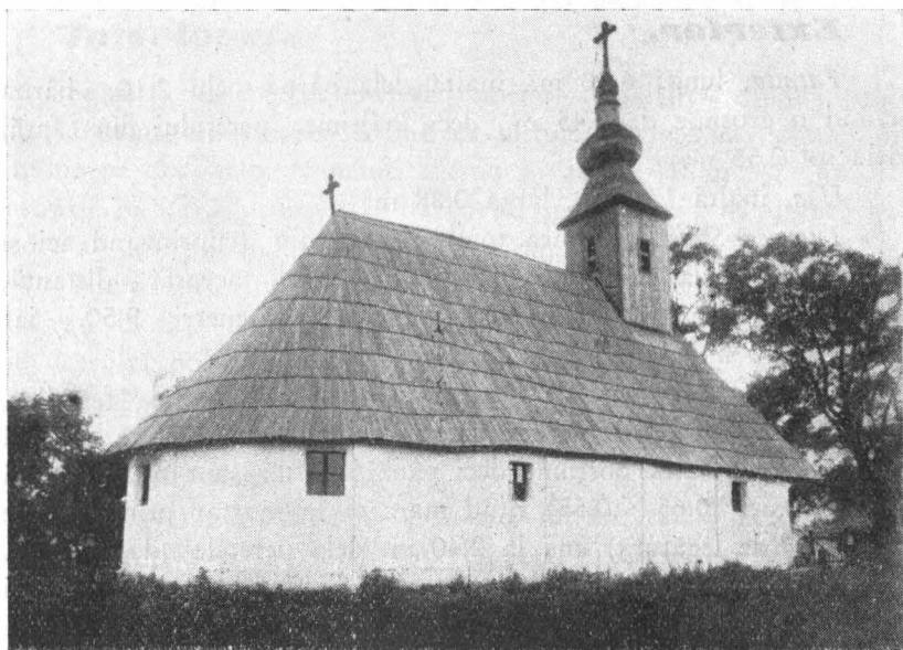
Biserica din Iersig

Pe un corp de bârne — astăzi acoperit cu mortar — și având un mic cerdac sprijinit pe stâlpi de lemn, se ridică acoperișul din