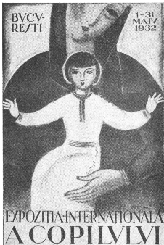
Afiș de Demian

De cealaltă parte, copiii cu fermecătoarea lor inexperiență, cu armonioasa lor desordine, cu întraripata lor nedisciplină, cu spaima lor pentru tot ce este impus prin tradiție și autoritate — și cu pa-