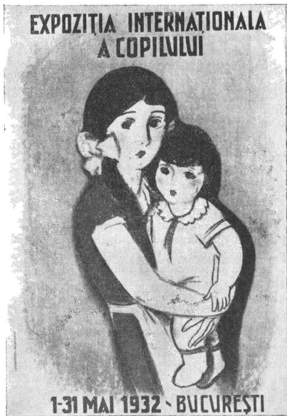
Afiș de Demian

Multe sisteme pedagogice au considerat (și consideră încă) copilul, nu ca un om în devenire, ci ca un om în miniatură și l-au