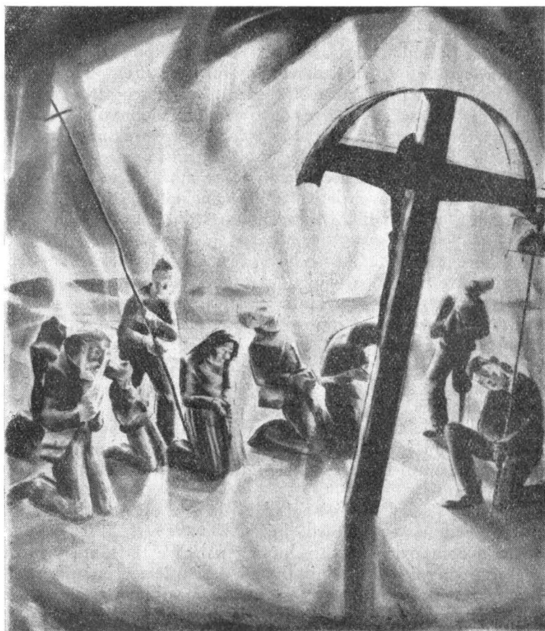
1. Podlipny: Christosul de tinichea

Acest pictor e de origină cehoslovac, din Bratislava; — e de remarcat faptul că la noi în țară își au operele principale încă doi