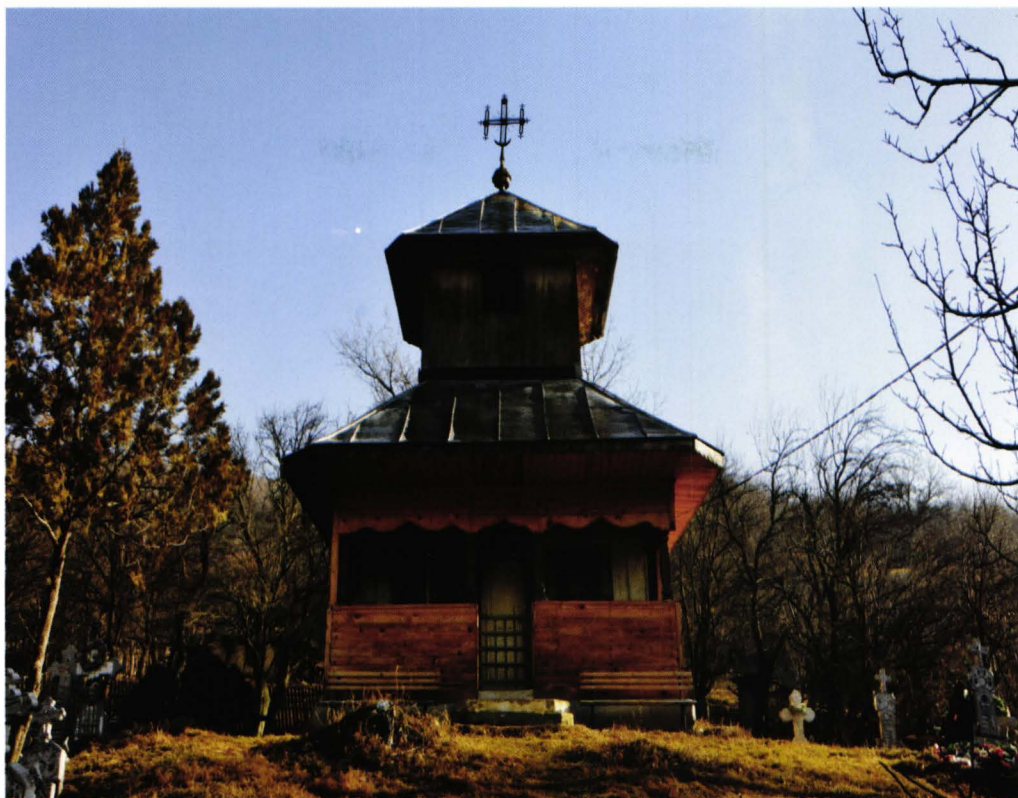
Biserica sat Nucu