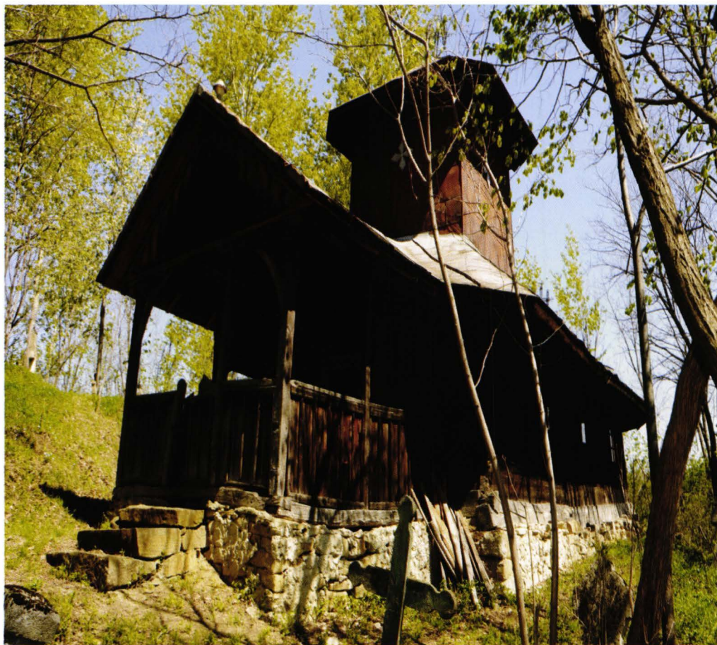
Biserica Bozioru de Sus