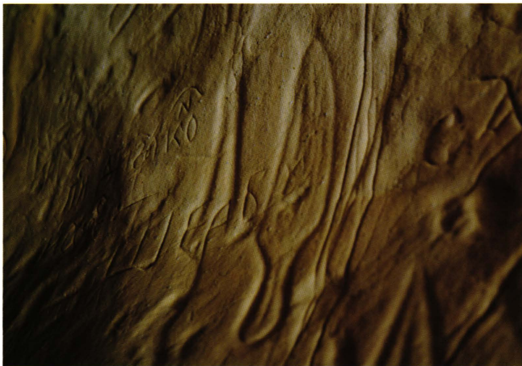
Inscripții Fundu Peșterii