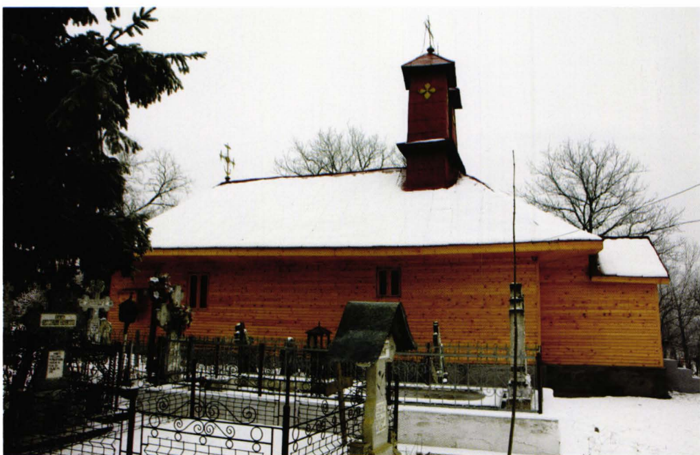
Biserica Sf. Voievozi, sat Râu