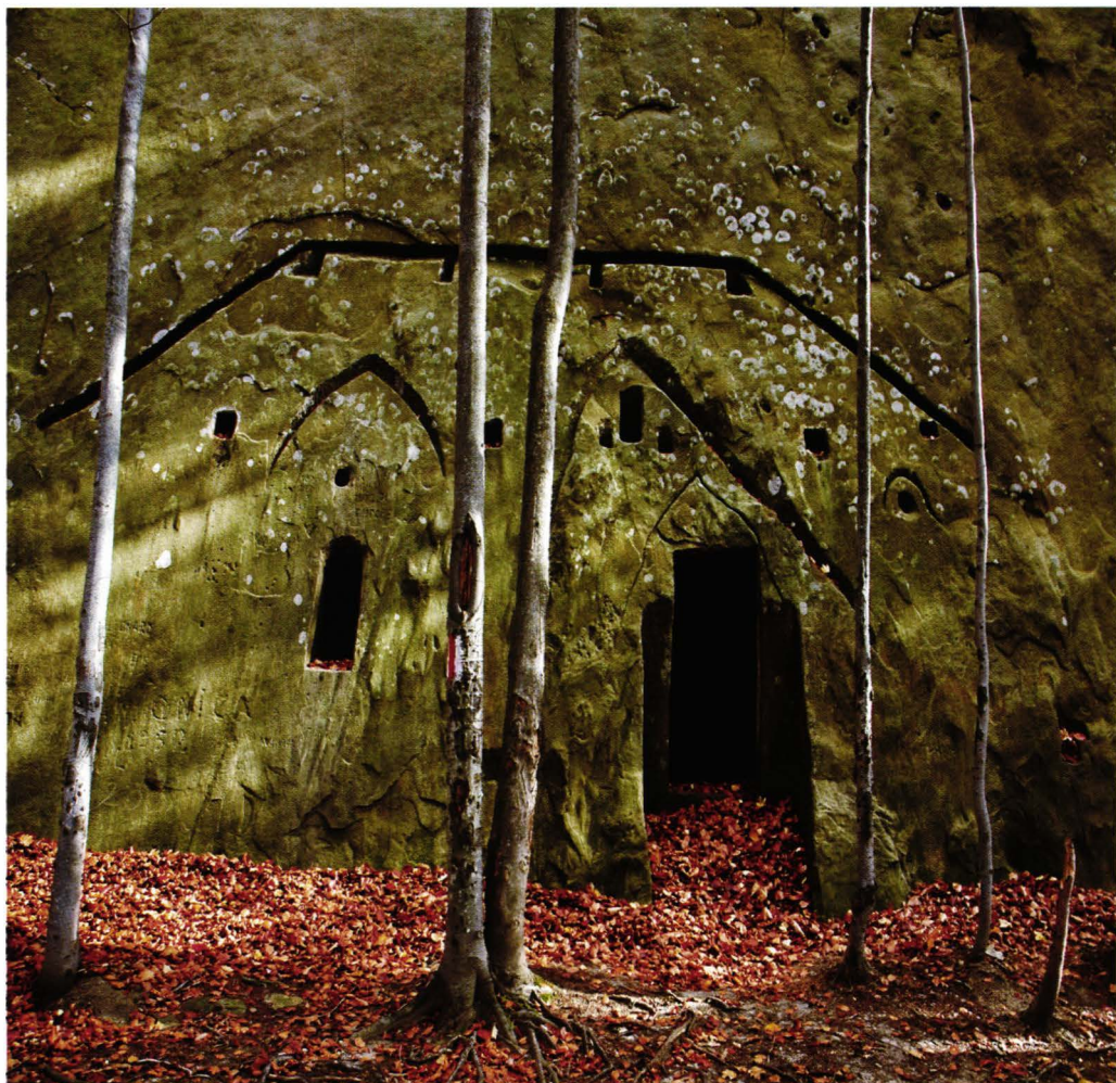
Bisericuța lui Iosif