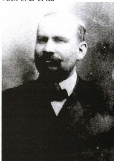
Foto. 4. Gh. Munteanu Murgoci la vârsta de 45 de ani