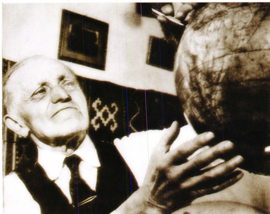
În intimitate cu Terra, Dumitru Dan își retrăiește odiseea (P. Diaconescu, Călătorii celebre... , în Suplimentul ziarului Scânteia , apr. 1968, p. 22)