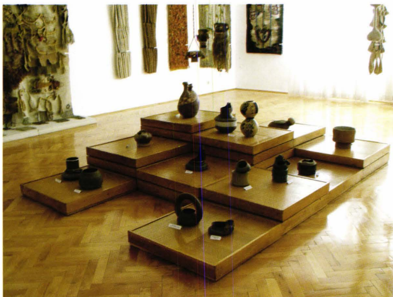
Foto. 9. Vase ceramică