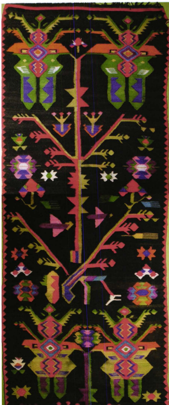
Foto. 1. Scoarță lucrată de un meșter popular din Muntenia