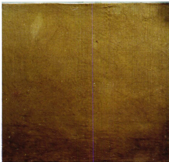
Foto 7. Antimis, 1830 - dublat după restaurare