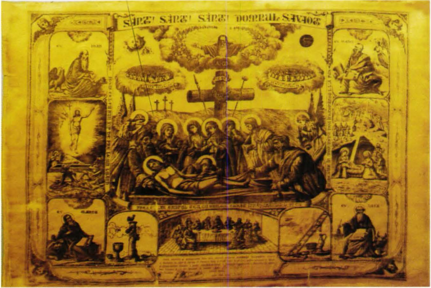
Foto 3. Antimis, 1905