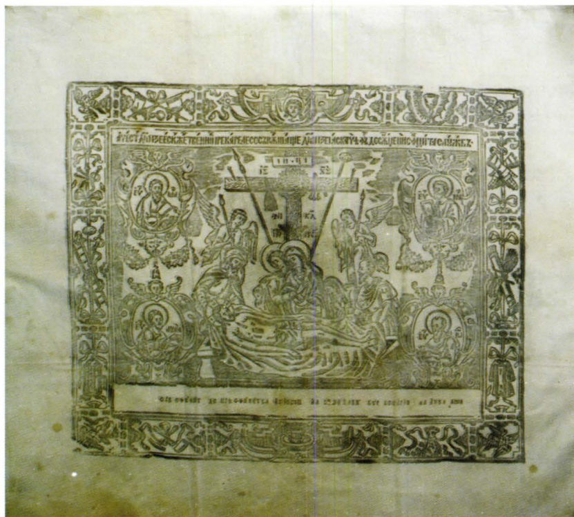
Foto 6. Antimis, 1830 - după restaurare