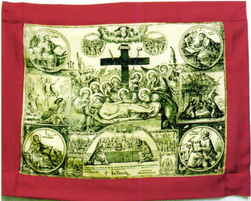
Foto 4. Antimis, 1980