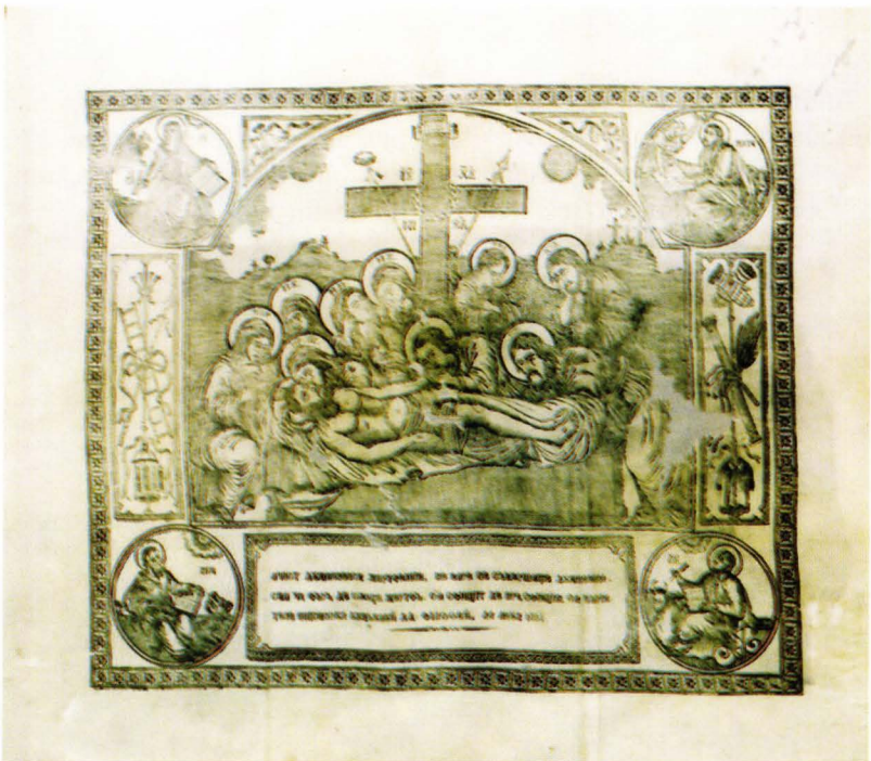
Foto 2. Antimis, 1851