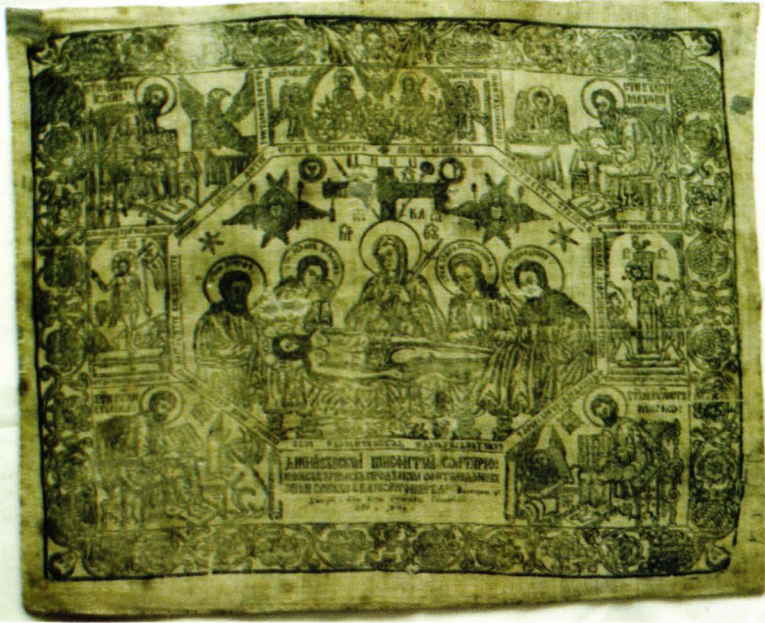
Foto 1. Antimis, 1766