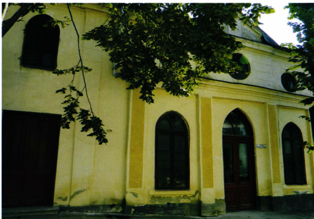
Sinagogă, str. Gheorghiița Lupescu, nr. 3.