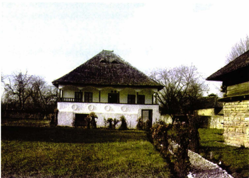
Casa de Chiojd din Muzeul Pomiculturii și Viticulturii Golești, jud. Argeș https://biblioteca-digitala.ro