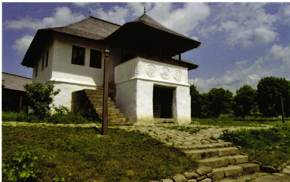
„Casa cu Blazoane”, sat Chiojd, județul Buzău