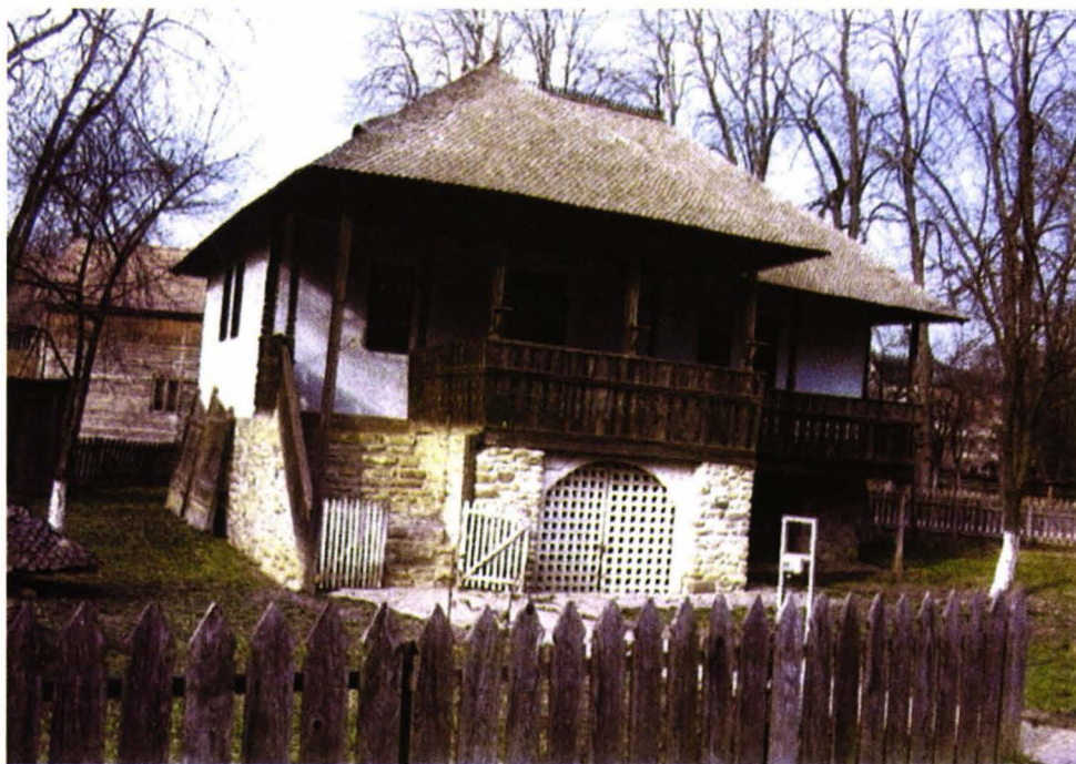
Casa de Chiojd din Muzeul Național al Satului „Dimitrie Gusti”, București