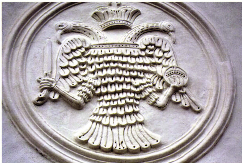
Blazonul „Vulturul bicefal”, heraldica familiei Cantacuzino