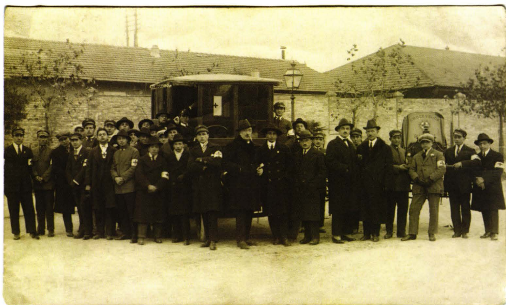
Fotografie alb-negru ilustrând 35 de membri ai Crucii Verzi din Rimini, 08.12.1923, nr. inv. MJB: 15565