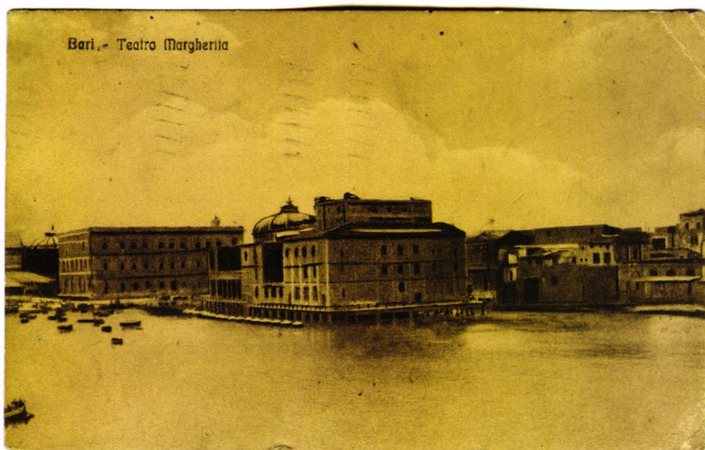
Carte poștală sepia ilustrând Teatrul Margherita din Bari, 18.10.1922, circulată, nr. inv. MSB: 3344_4