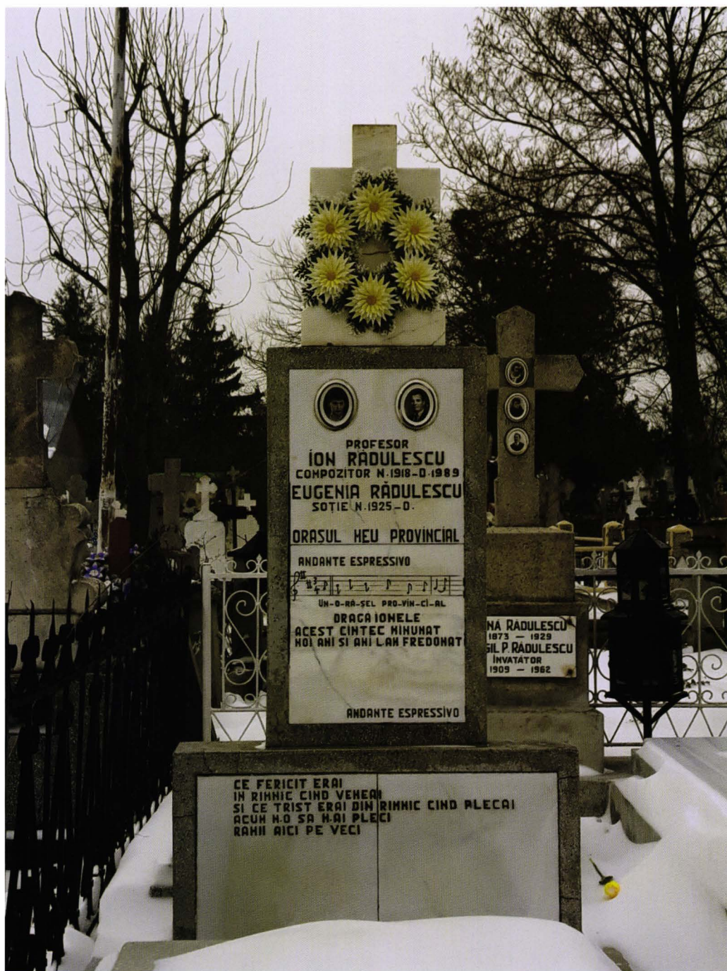
Fig. 8. Mormântul compozitorului