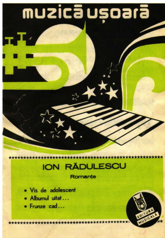
Fig. 6. Partitura „Romante”