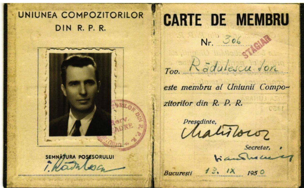
Fig. 4. Carnet de membru al Uniunii Compozitorilor