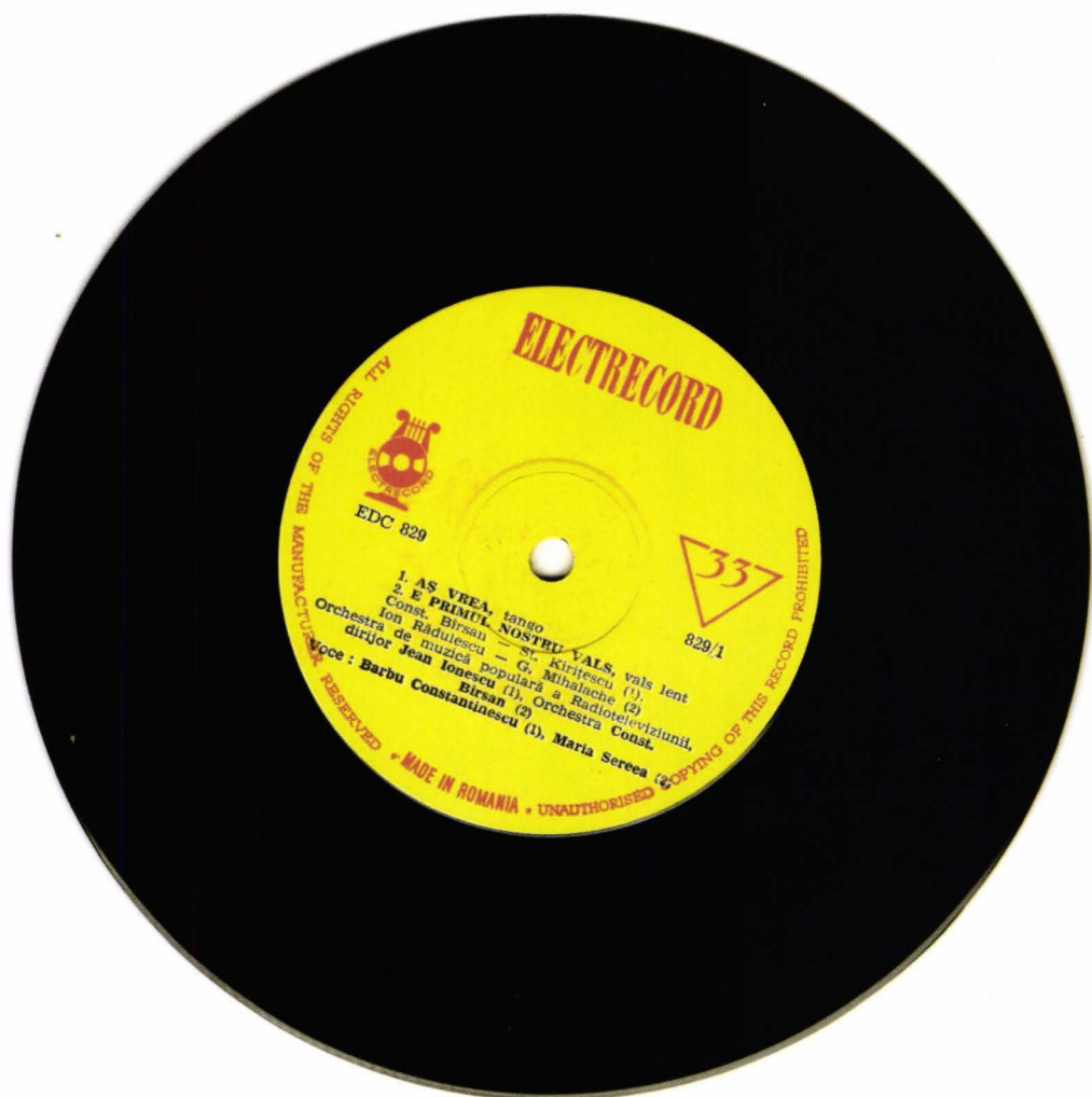
Fig. 7. Disc, inv. 3415