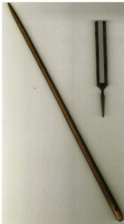
Fig. 5. Bagheta și diapazonul compozitorului