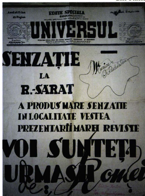
Fig. 3. Afișul spectacolului „Voi sunteți urmașii Romei?”, 1940