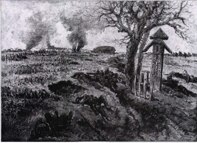
27 decembrie 1916, Bătălia pentru Râmnicu Sărat: desen de Albrecht Reich de la „Illustriren Zeitung”, în „Lumea de Foc”, vol. 3, de Paul Schreckenbach, Leipzig, 1920