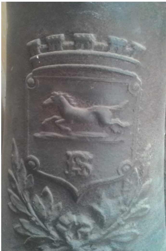
Detaliu pe o cișmea din fontă (Râmnicu Sărat, perioada interbelică)