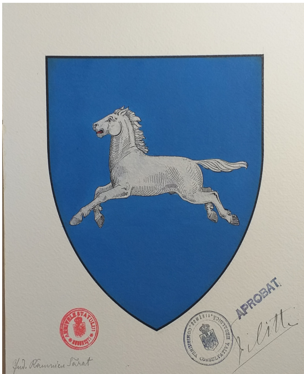
Stema județului Râmnicu Sărat (aprobată) – 1922