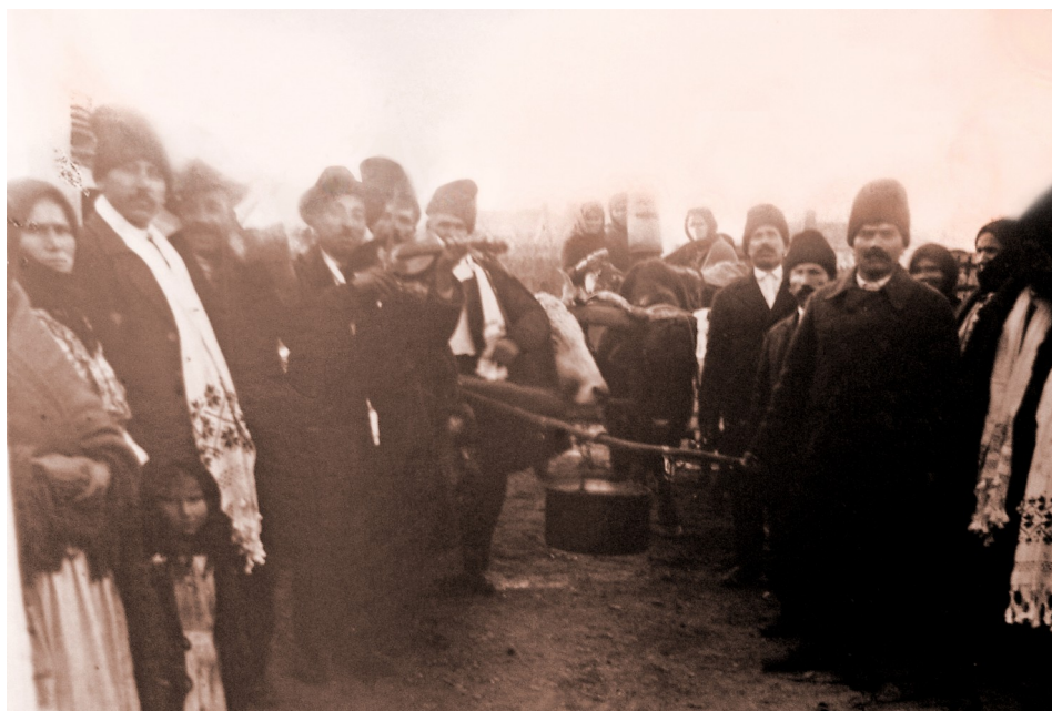
Fotografii nuntă în comunitatea de bulgari din Buzău (1935-1940)