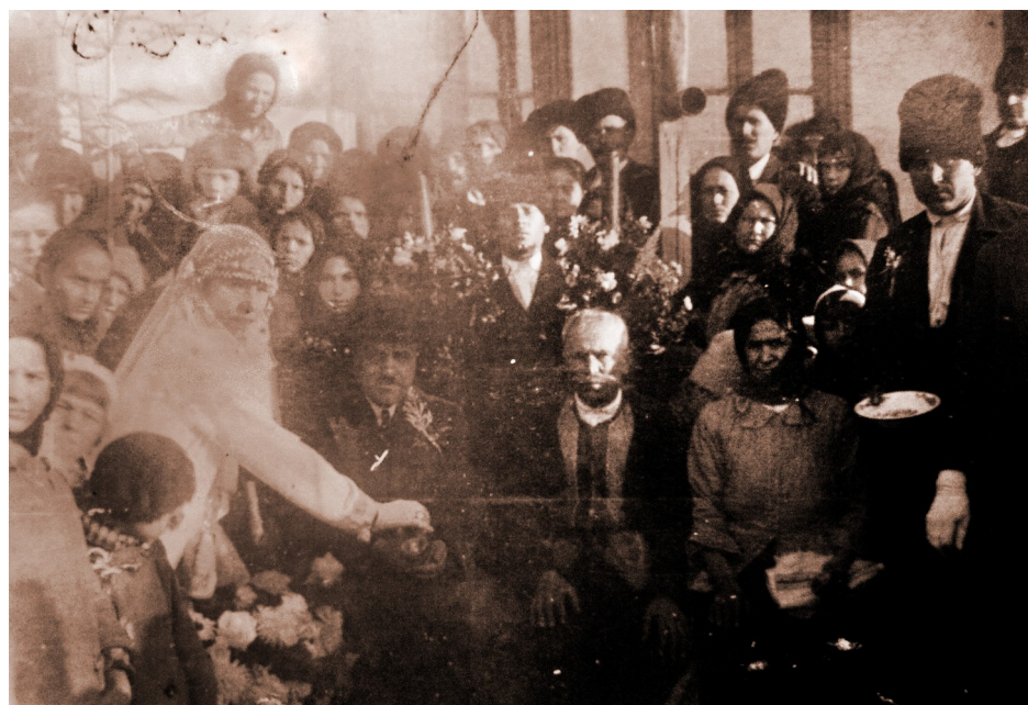
Fotografii nuntă în comunitatea de bulgari din Buzău (1935-1940)