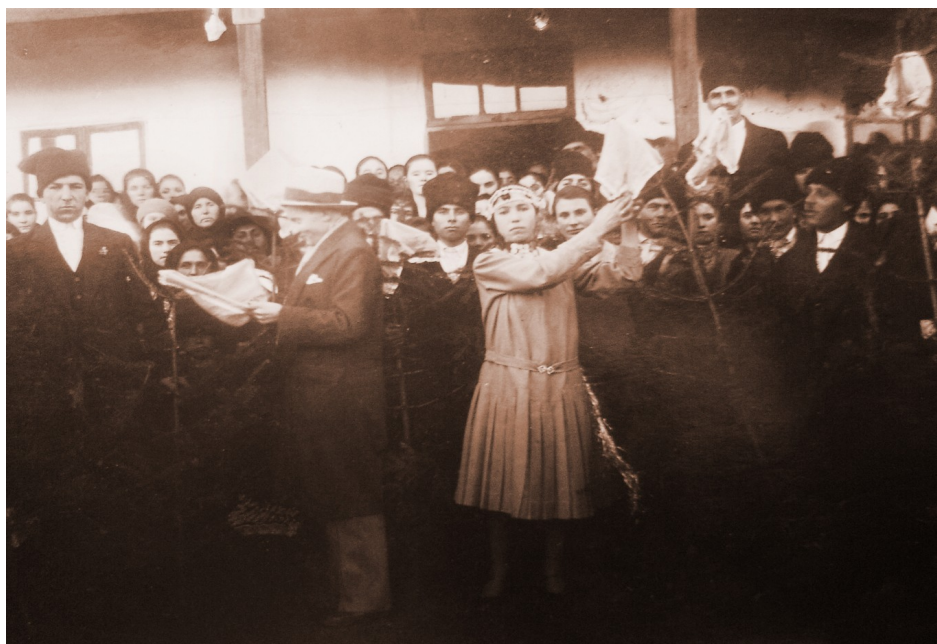
Fotografii nuntă în comunitatea de bulgari din Buzău (1935-1940)