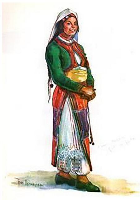
Costum popular bulgăresc (sec. XIX)

Este cert, multe dintre tradițiile și obiceiurile bulgarilor din România au dispărut sau vor dispărea, acesta fiind un proces inevitabil datorat poate globalizării, poate și dorinței de a ține pasul cu evoluția societății contemporane în care trăiesc. Un lucru însă rămâne cert: așezarea grădinarilor bulgari în România și, în special, în spațiul buzoian, a fost un lung proces istoric, și astăzi face parte din istoria orașului și a județului nostru, care i-a adoptat ca o mamă bună.