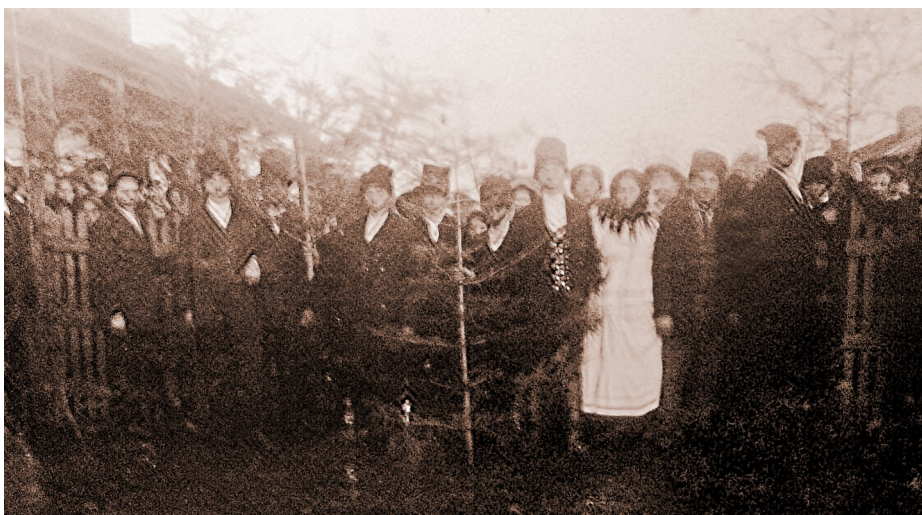
Fotografii nuntă în comunitatea de bulgari din Buzău (1935-1940)