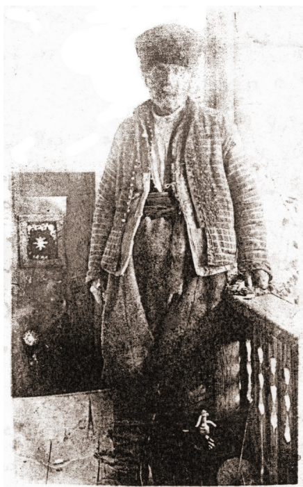
Negustor bulgar (1890)