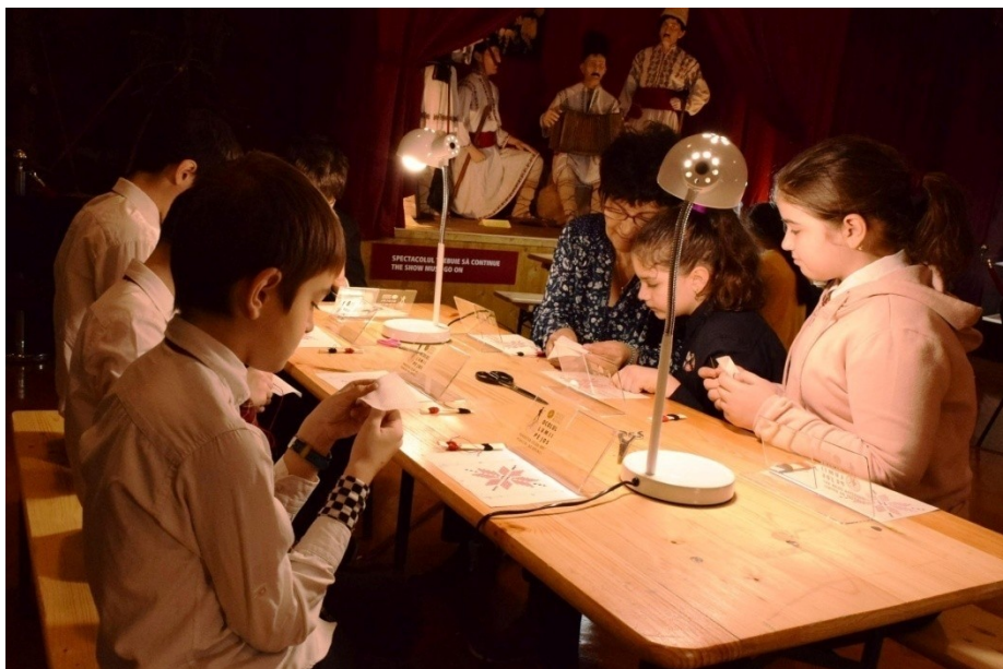
Atelier meșteșugăresc Semne tradiționale cusute