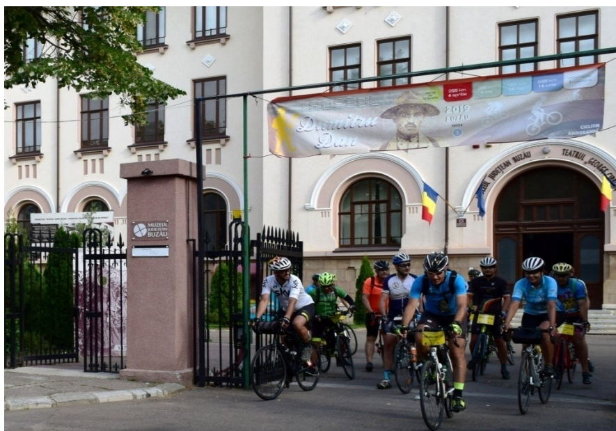
Startul primei ediții a Trofeului Dumitru Dan, 2019