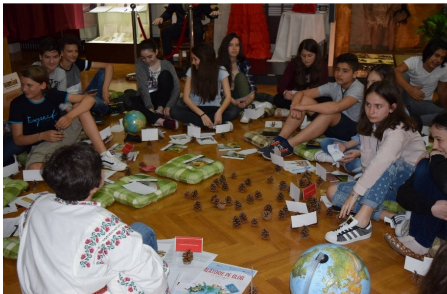
Lecția de storytelling Călătorie pe glob