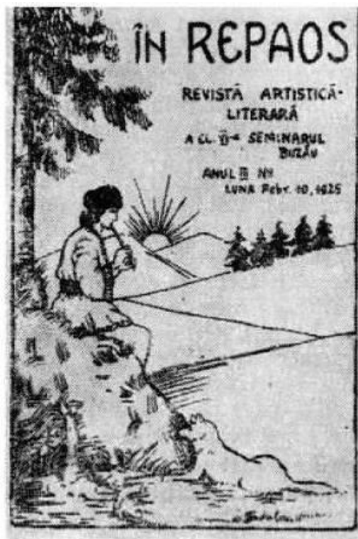
În Repaos (1923 - 1925, Buzău)