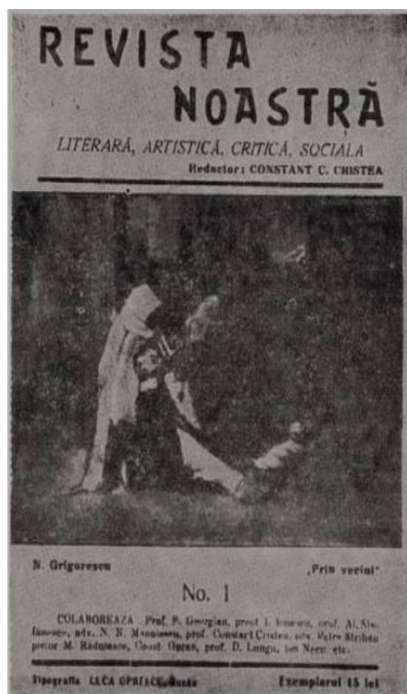
Revista noastră (1 ian. - oct./dec. 1927, Buzău)