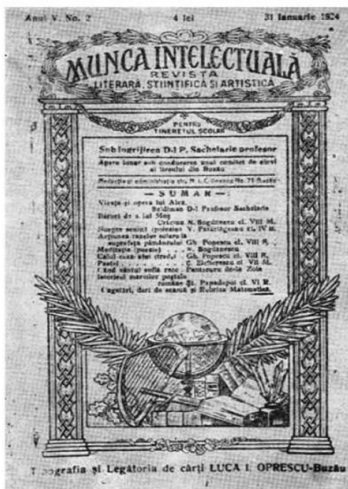
Munca Intelectuală (1 oct. 1919 - mai 1926, Buzău)