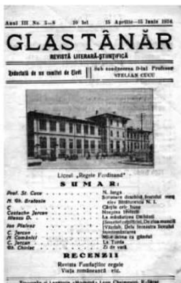
Glas tânăr , (23 feb. 1932 - sept. 1941/apr. 1942, Râmnicu Sărat)