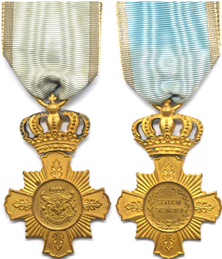
Crucea „Serviciul Credincios” clasa I, model 1906 (avers și revers)