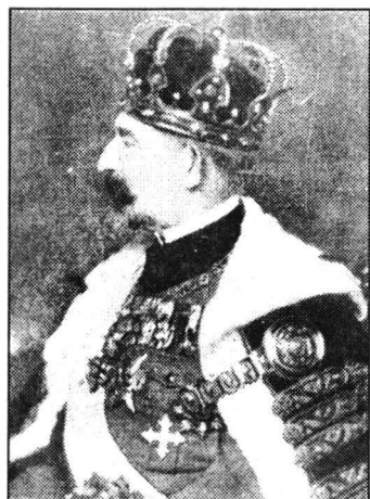
Regele Ferdinand (1865-1927)