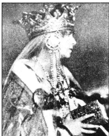
Regina Maria (1875-1938)