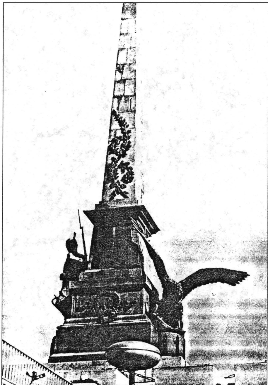
Monumentul Independenței (Tulcea)