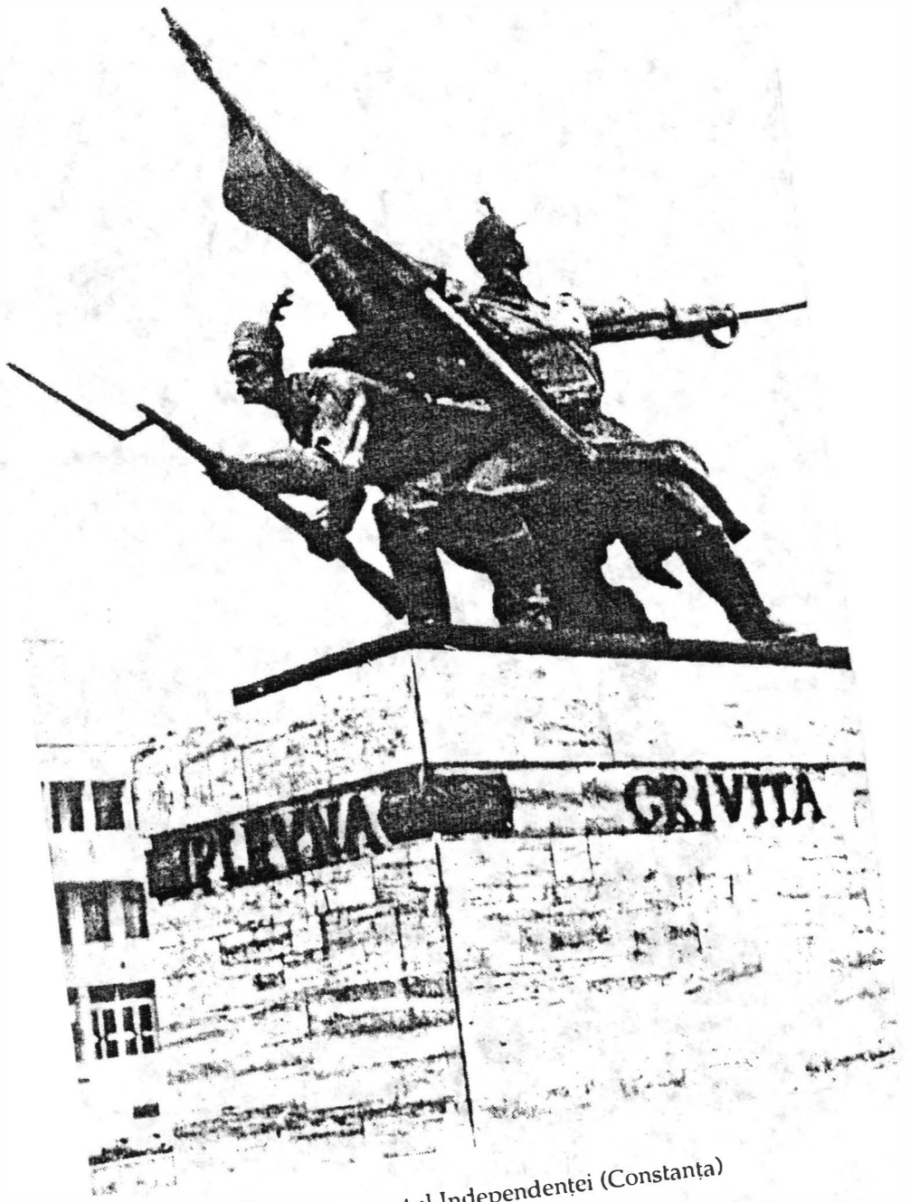
Monumentul Independenței (Constanța)