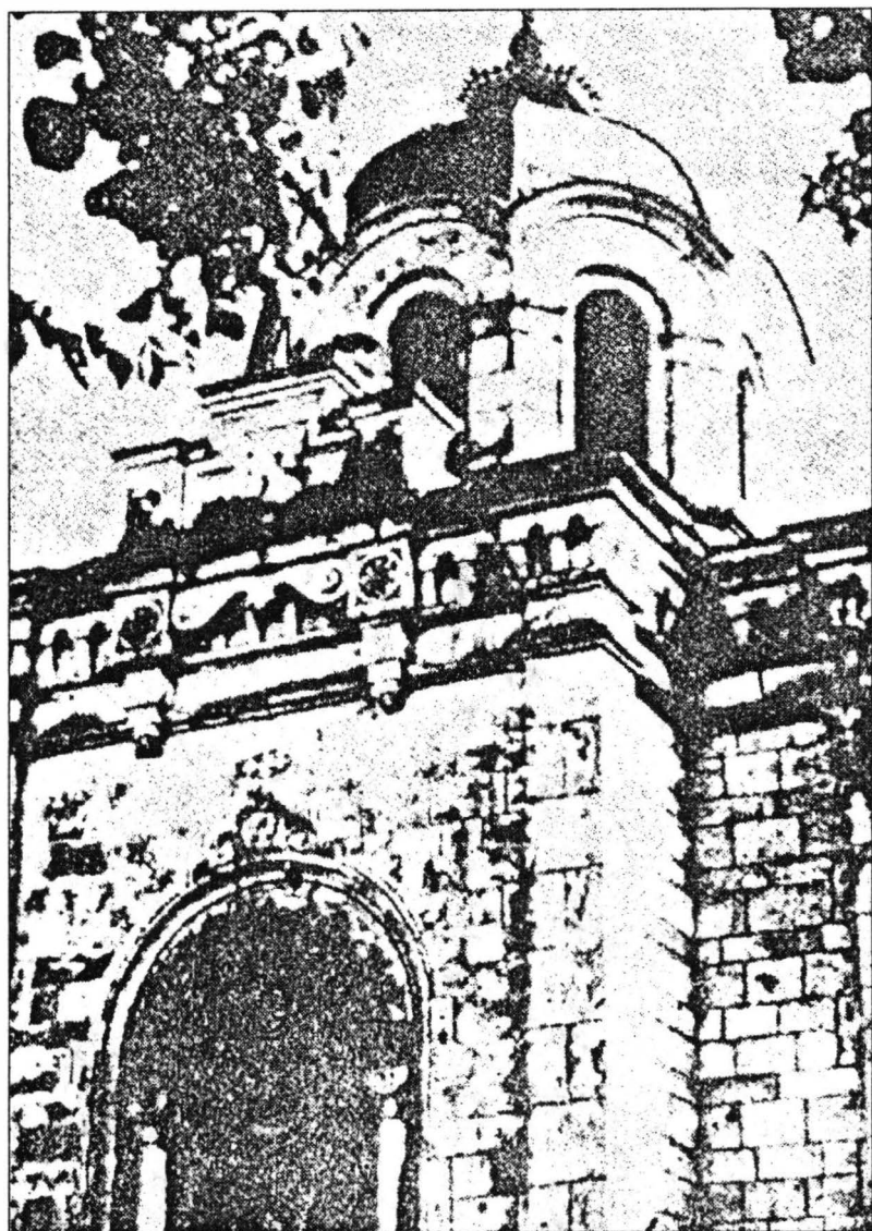
Mausoleul ostașilor români înălțat la Grivița