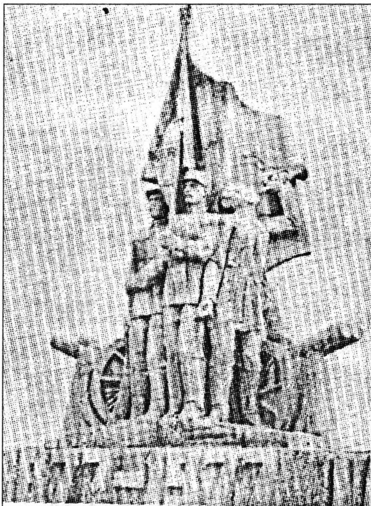
Monumentul Independenței (Calafat)