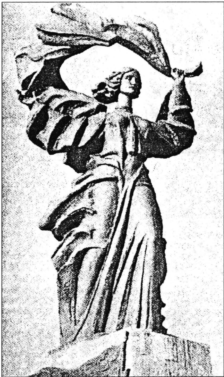
Monumentul Independenței din Iași