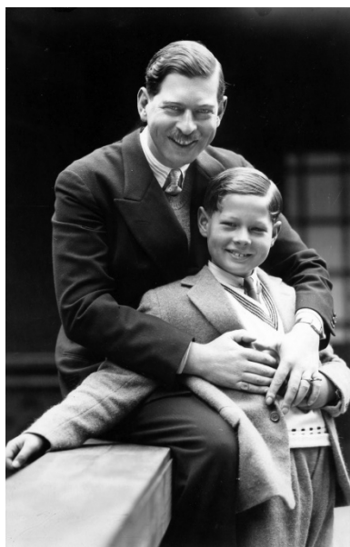
1930. Regele Carol al II-lea și Marele Voievod Mihai