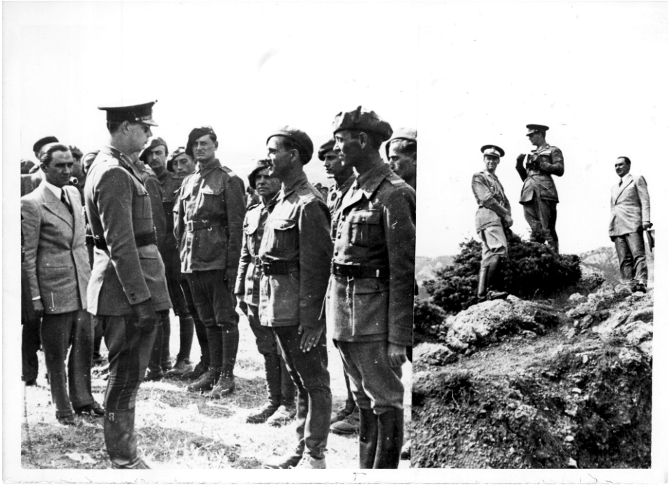
1942. Inspecția Regelui Mihai pe front.