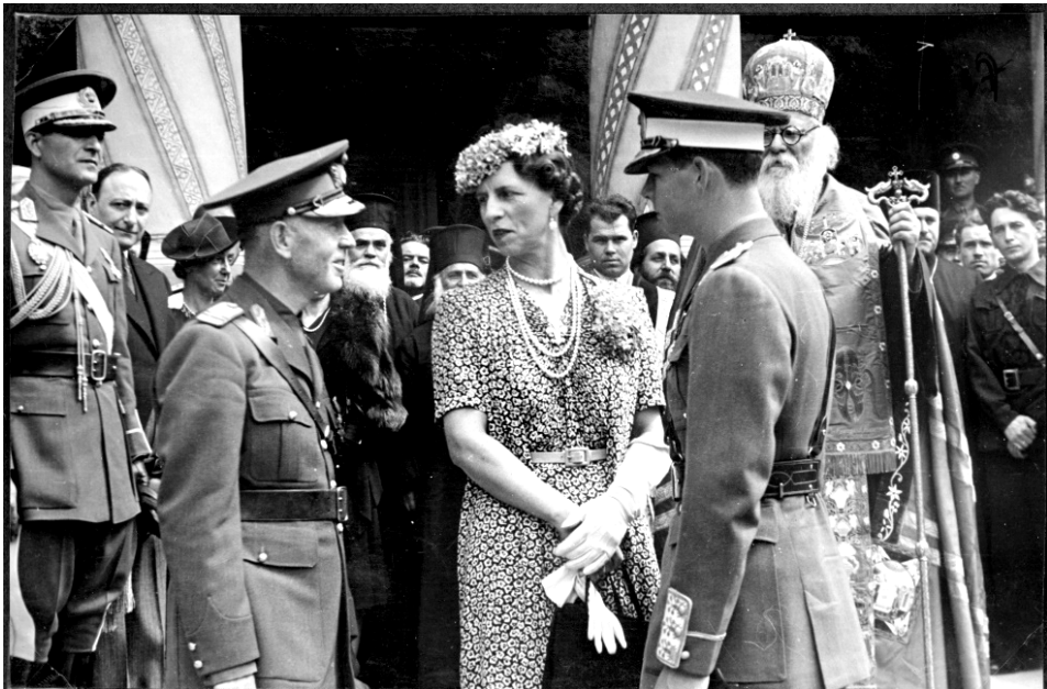
1940. Regele Mihai, Regina-mamă Elena și generalul Ion Antonescu, în fața Patriarhiei.