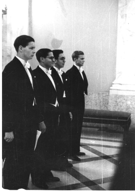
1940, iunie 27. Marele Voievod Mihai și colegii săi, după susținerea examenului de bacalaureat.