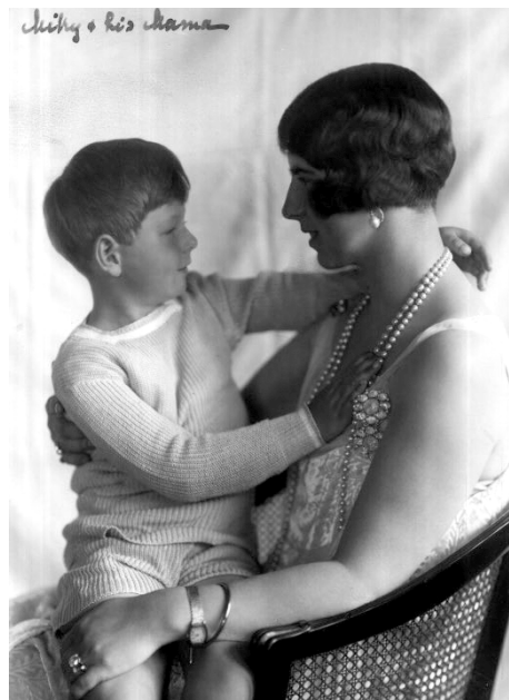
1927. Principele Mihai și mama sa, principesa Elena.