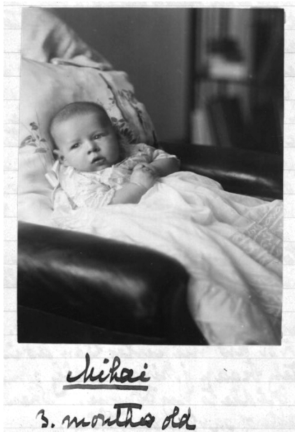
1922. Principele Mihai la 3 luni.