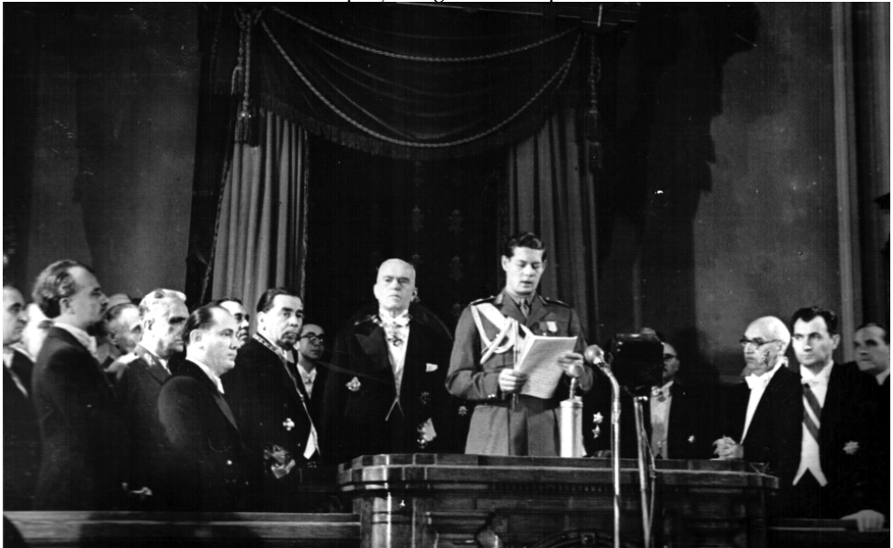
1946, decembrie 1. Discursul Regelui Mihai în Parlament, după alegerile din 19 noiembrie 1946.