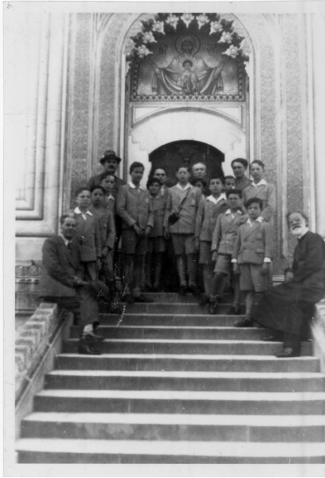
1933. Elevii Clasei Palatine