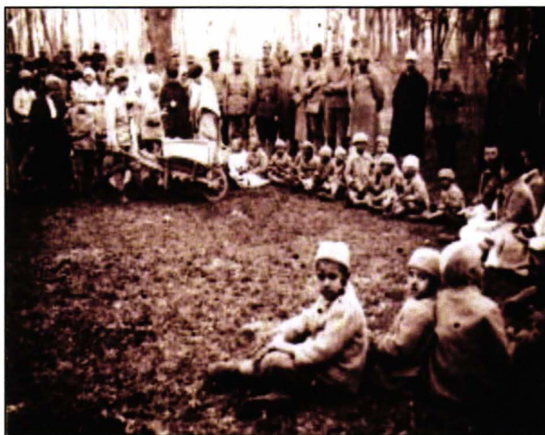
Copiii orfani primeau hrană de la bucătăriile de campanie ale unităților militare

Comandantul Regimentului 10 Vânători a raportat forului superior al armatei (Ministerul de Război) că adăpostea și îngrijea cinci copii orfani, doi dintre ei urmau cursurile școlii primare, iar ceilalți trei erau internați în spital, în garnizoana Brașov, fiind bolnavi. Regimentul 2 Vânători nu avea camere disponibile pentru a mai primi copii, deși avea cazați doi. Regimentul 6 Vânători avea o cameră disponibilă cu șase paturi, însă niciun copil. Regimentul 4 Infanterie avea două camere în cazarmă, cu 14 și, respectiv, 17 paturi și îngrijea 11 copii. Alături de aceștia, alți 253 fuseseră îngrijiți de militarii unității, copii care au fost „în trecere” prin cazarmă, adică nu au fost cazați permanent, ci doar atât cât au avut nevoie de ajutor. Regimentul 20 Infanterie a raportat că, în perioada 23-29 ianuarie 1920, a îngrijit cinci copii, deși dispunea de două camere cu 11 paturi pentru orfani și 16 pentru invalizii de război. Regimentul 5 Infanterie avea puși pe ordinea de zi zece copii orfani, însă