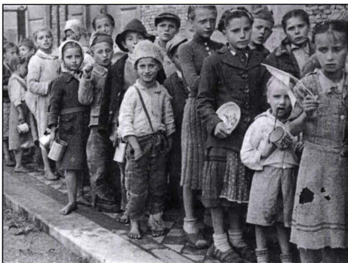
Copii orfani, la coadă, așteptând porția de hrană

După război, autoritățile militare centrale și teritoriale (șefii marilor corpuri de armată) au colaborat cu filialele județene ale Societății pentru ocrotirea orfanilor de război , cu scopul instituționalizării acestor marginali în spațiul cazon al cazarmilor, fără a se încerca, însă, militarizarea lor. Membrii activi ai societății au întocmit situații cu numărul copiilor orfani care aveau nevoie de îngrijire, cu