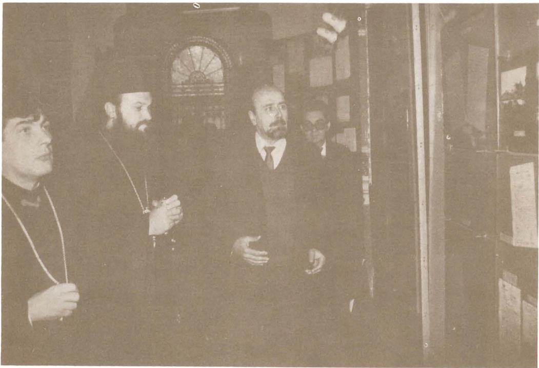
Vernisajul expoziției "Oameni de seamă ai Arhivelor" - octombrie 1994.