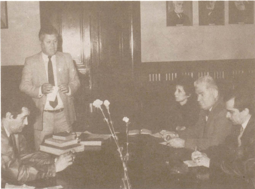
Săptămâna Internațională a Arhivelor. "Arhivele și cercetarea istorică" - mai 1994.