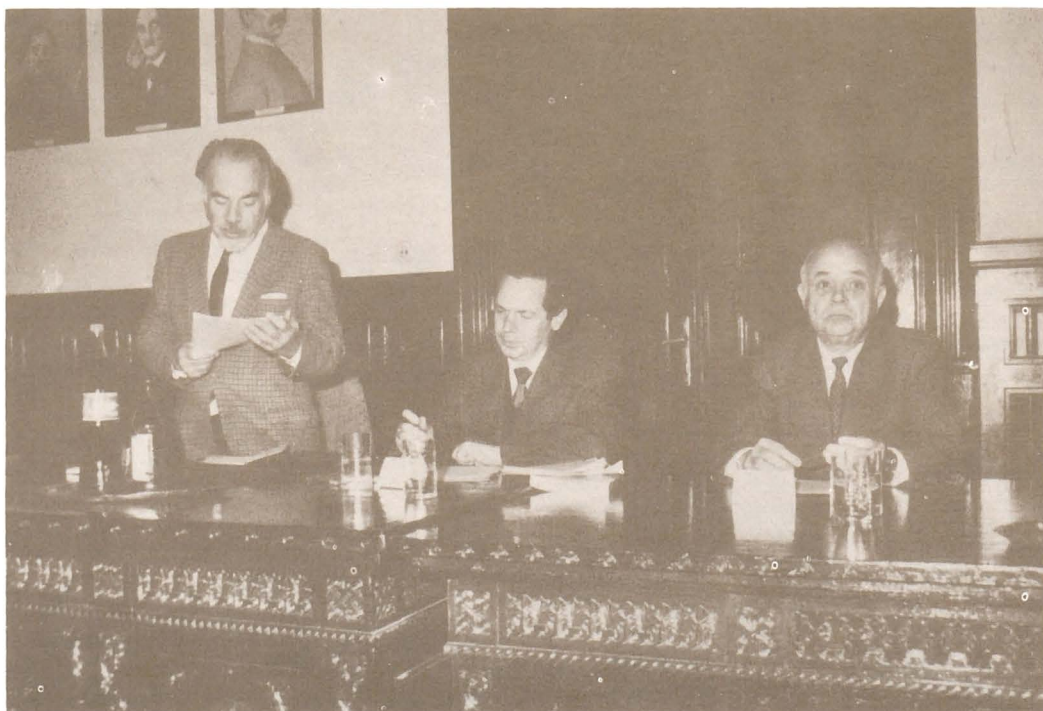
Simpozionul "Arhivele de ieri și astăzi" - octombrie 1994.