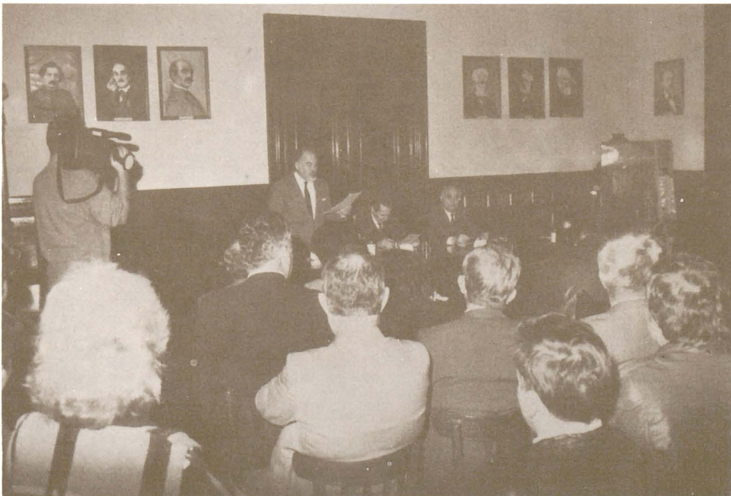
Simpozionul "Arhivele de ieri și astăzi" - octombrie 1994.