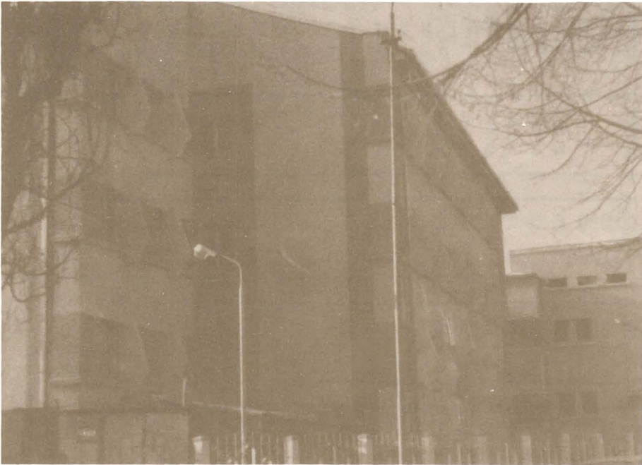
Noua clădire a Arhivelor Statului din Bacău, finalizată în 1994.