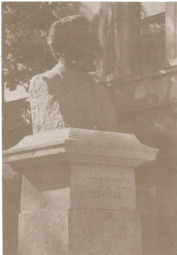
Bustul lui Dimitre Onciul, director al Arhivelor Statului între anii 1900-1923, reșezat lângă clădirea Direcției Generale a Arhivelor Statului - octombrie 1994.