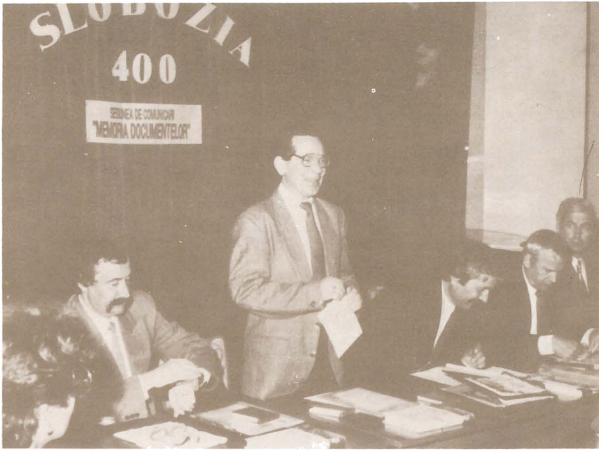
Săptămâna Internațională a Arhivelor. Sesiunea de comunicări "Memoria documentelor - Slobozia 400" - mai 1994.