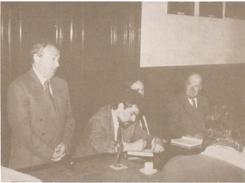
Săptămâna Internațională a Arhivelor. "70 de ani ai Revistei Arhivelor" - mai 1994.