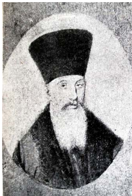
Fig. 2. Gheorghe Hermeziu postelnic (după C. Gane, op. cit. , între p. 46 și 47)