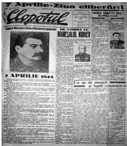
Fig. 1. Numărul aniversar din 8 aprilie 1945