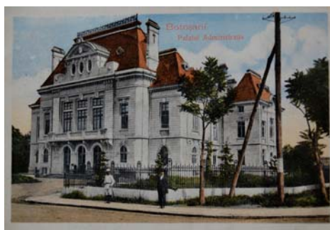
Fig. 4. Prefectura județului Botoșani