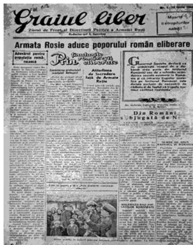
Fig. 2. Primul număr din 19 iunie 1944