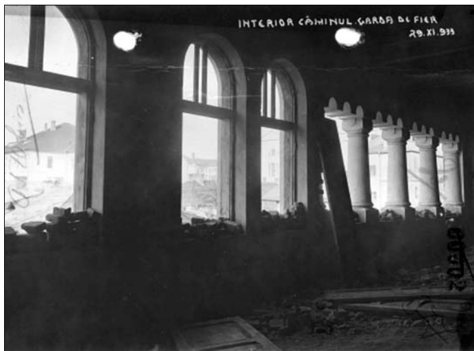
Fig. 3. Inside the Cămin, 29 November, 1933