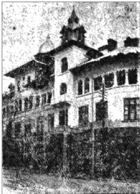
Fig. 2. Cămin Cultural Creștin (“Pământul strămoșesc”, an. IV, nr. 8, 1 ianuarie 1931, p. 3)

N. Arnăutu heard him and called back “Where are your Assault Battalions?” Arnăutu whistled, and fifteen legionary students immediately appeared, armed and ready to fight. Only the presence of policemen prevented bloodshed. 89 The conflict continued into April, when eight Legionaries and seven cuzists were arrested after the two groups clashed once again. 90 Sometimes the fighting revolved around organizational symbols rather than property or territory. Legionaries stole an ASC flag when the building was evacuated by the police later that year, but then it went missing from a Legionary’s room where it was being held. Accusations of treachery immediately flew back and forth between legionaries, and Ion Banea promised to shoot any legionary who was found to have allowed their rivals’ flag to be stolen. 91 The cuzists responded by stealing a legionary flag from the Cămin , and an open battle ensued. Both sides were armed with clubs and knives, and three of the combatants ended up in hospital with serious injuries. Banea replaced Mociulski as ASC president later in 1933, and promptly announced “the student movement has begun anew. It is led by the legionaries.” 92