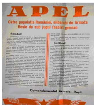
Fig. 5. Afişe propagandistice emise de Comandamentul Armatei Roșii