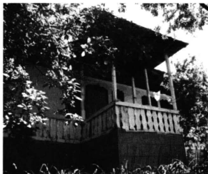
Cochirleni – case și anexe gospodărești