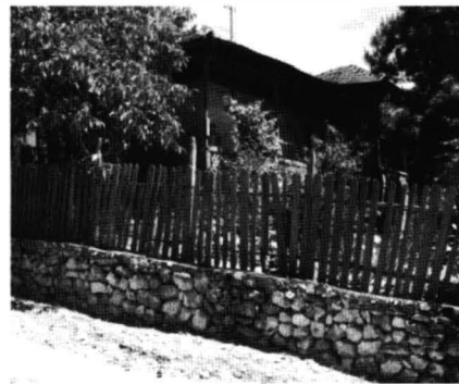
Cochirleni – case și anexe gospodărești