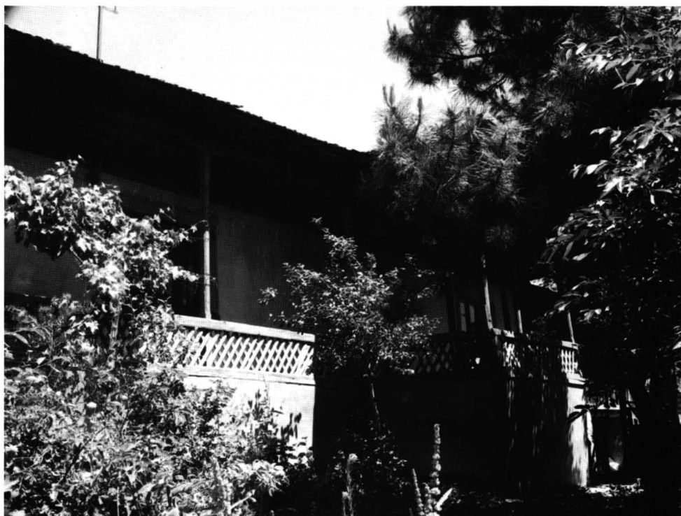
Cochirleni - Casa nr. 3