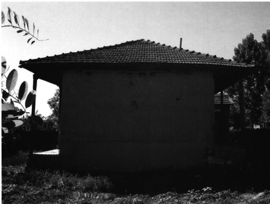
Cochirleni - Casa nr. 5