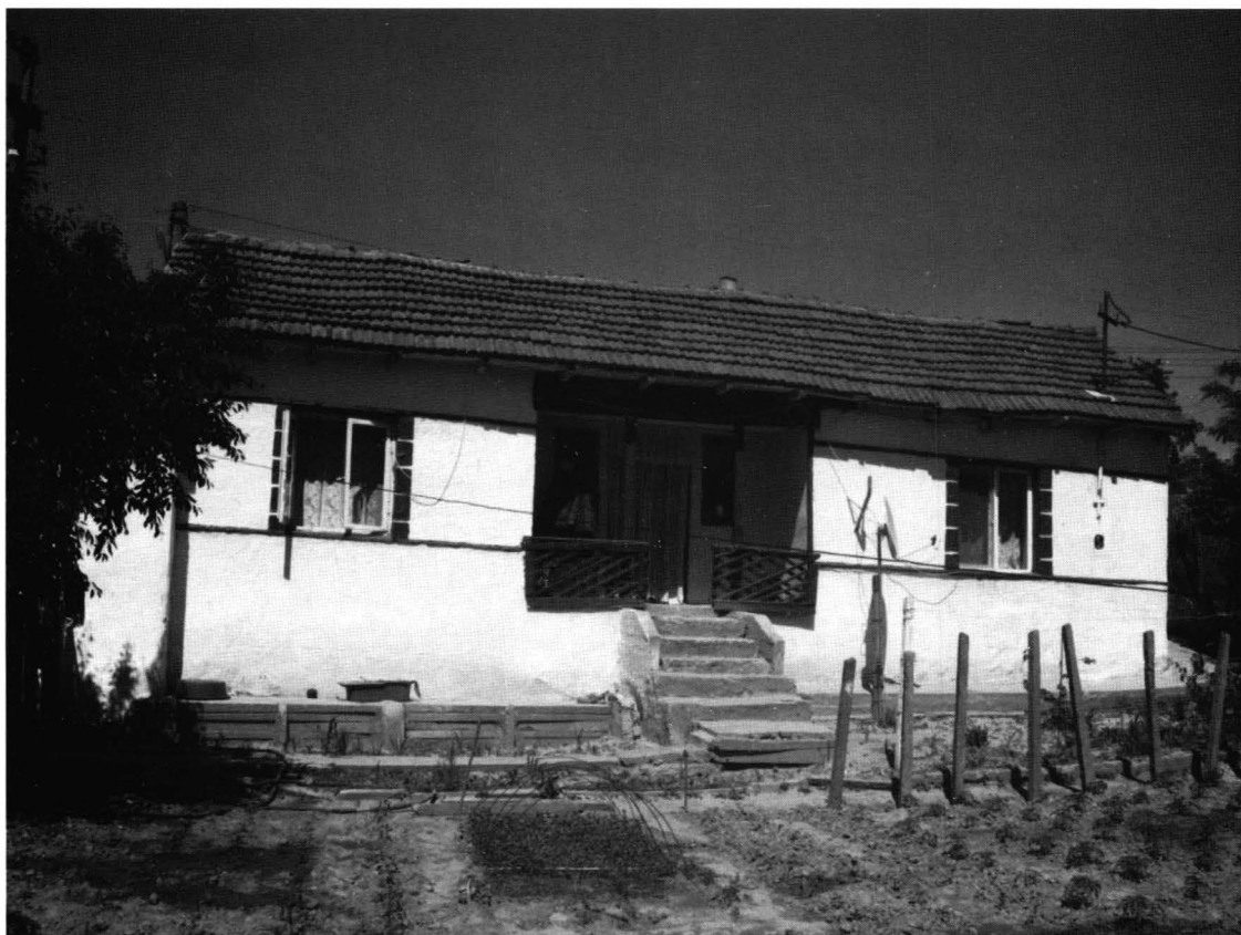
Cochirleni - Casa nr. 4