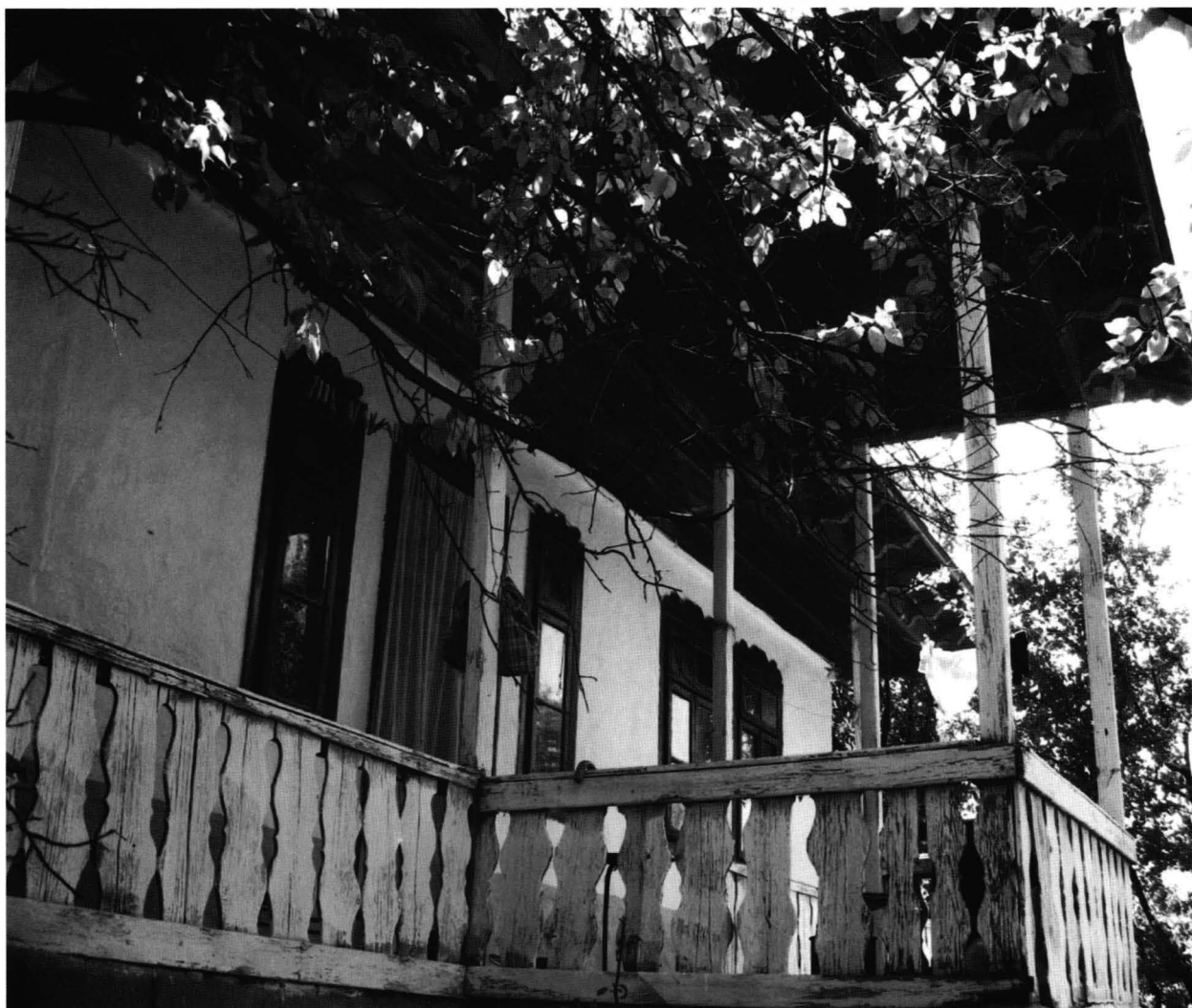
Cochirleni - Casa nr. 1

Gardul ce împrejmuiește gospodăria este din scânduri de lemn.