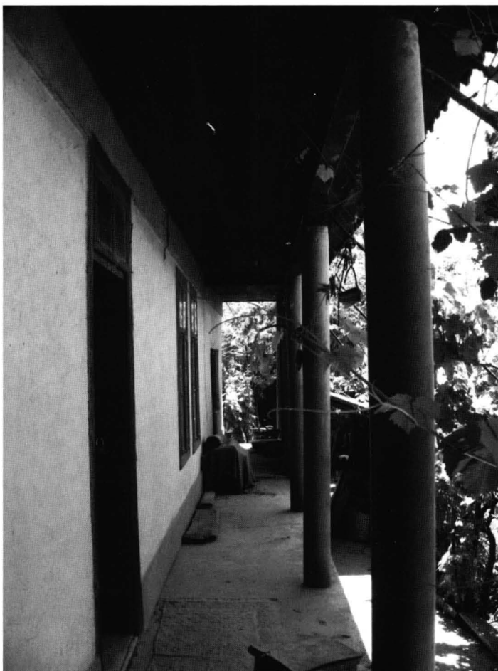
Cochirleni - Casa nr. 2