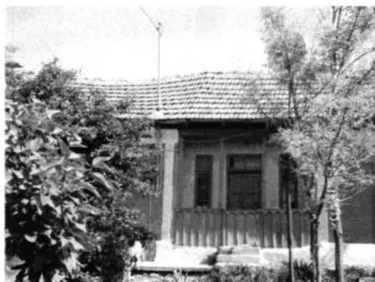
Runcu - case