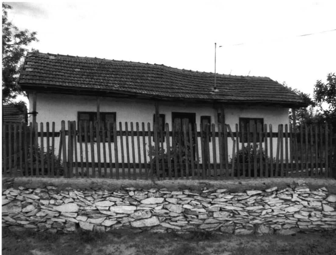
Runcu – Casa nr.2