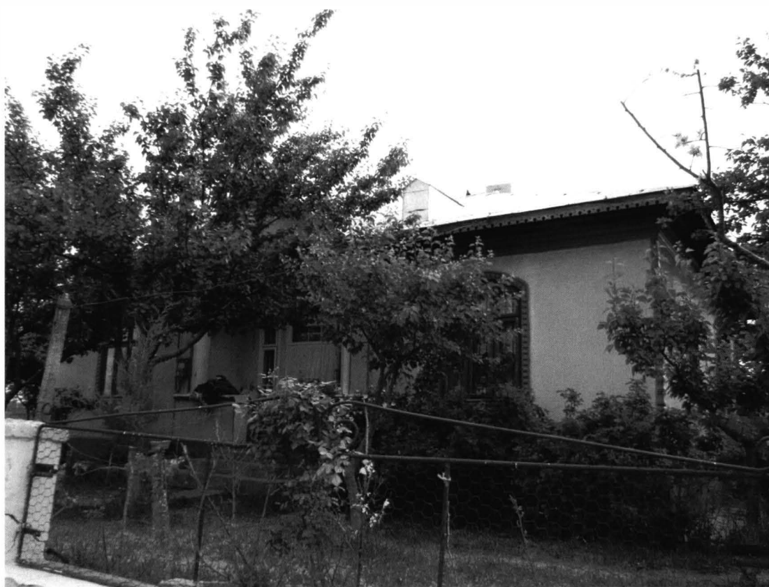
Runcu – Casa nr.1

laturi, ferestre înguste. În spatele casei se află o aplecătoare, desfășurată pe toată lungimea, cu ușă de acces, două ferestre și încă o fereastră adițională pe latura stângă. Învelitoarea este în patru ape, cu fronton în dreptul balconului și o lucarnă pentru luminarea și aerisirea podului. Casa are fațada orientată spre uliță, fiind la intersecția dintre două ulițe și prezintă un gard din piatră văruiat cu alb, cu coamă din lut și scânduri de lemn.