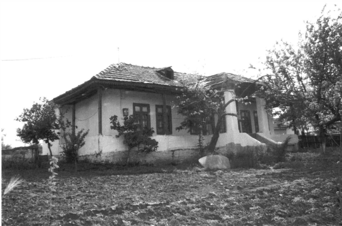
Runcu – Casa nr.3