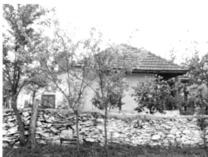
Runcu – case