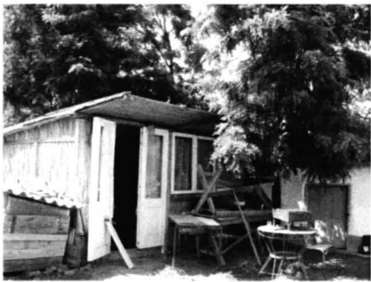
Istria – Case