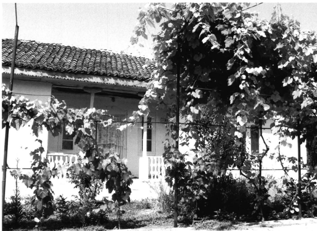
Istria – Casa nr. 2