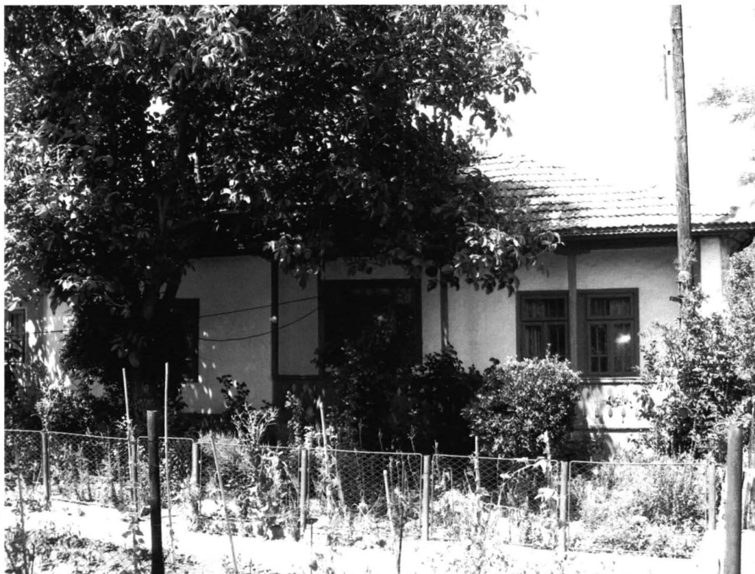
Istria – Casa nr. 1