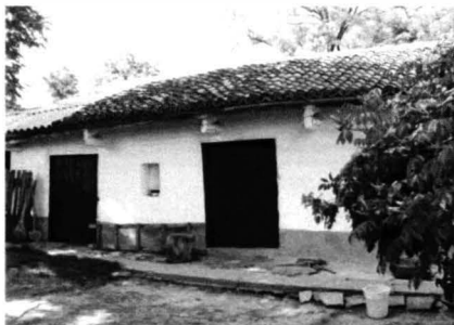
Istria - Case