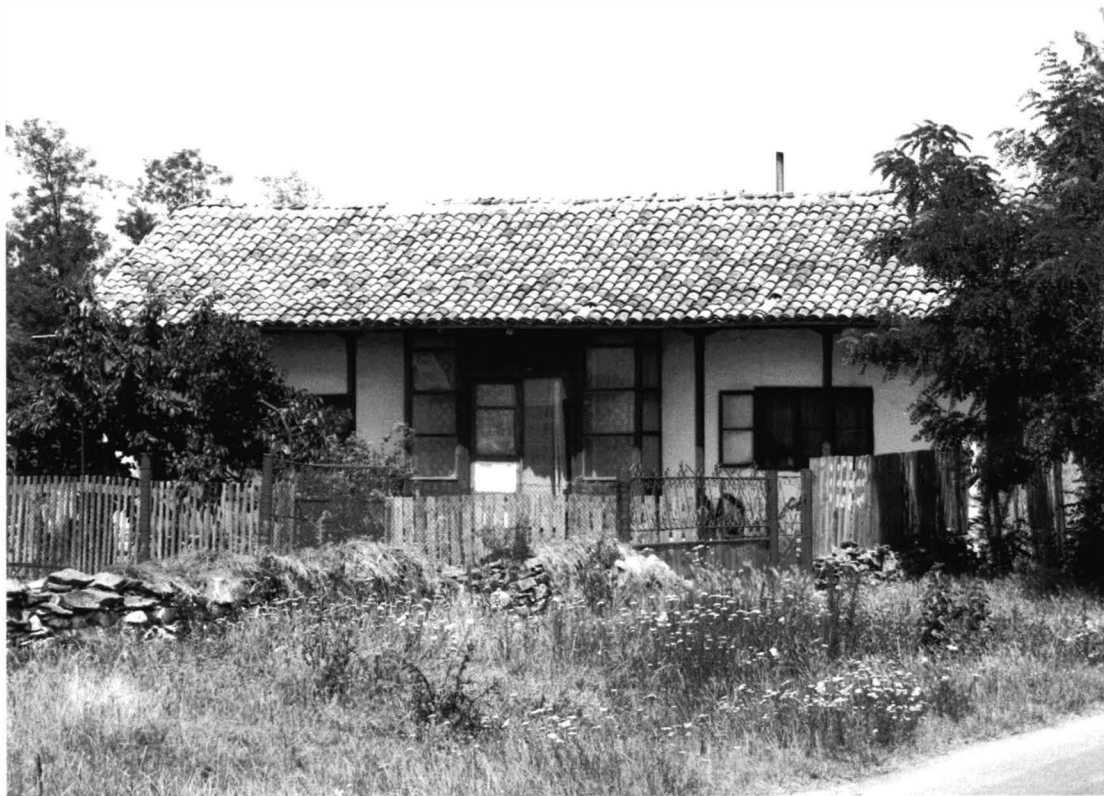
Istria – Casa nr. 4