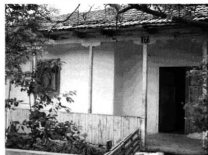
Tîrgușor - Case