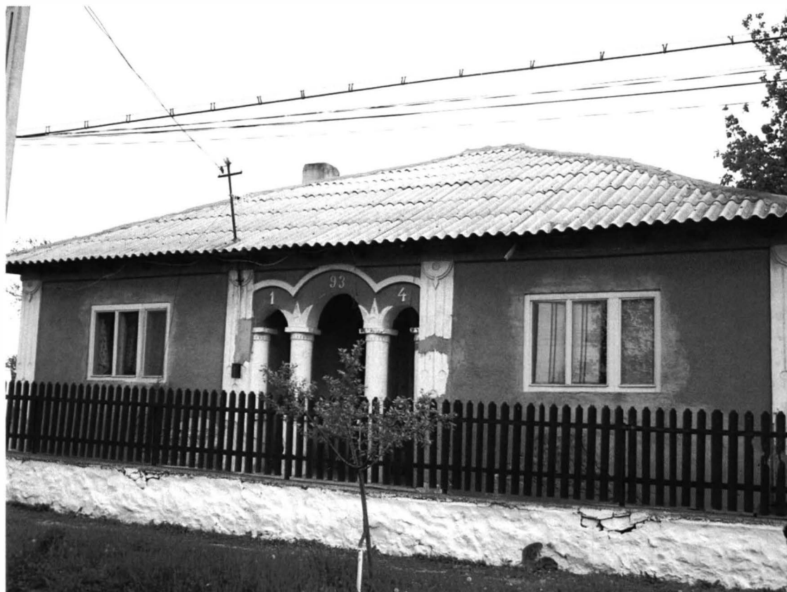
Tîrgușor – Casa nr.3