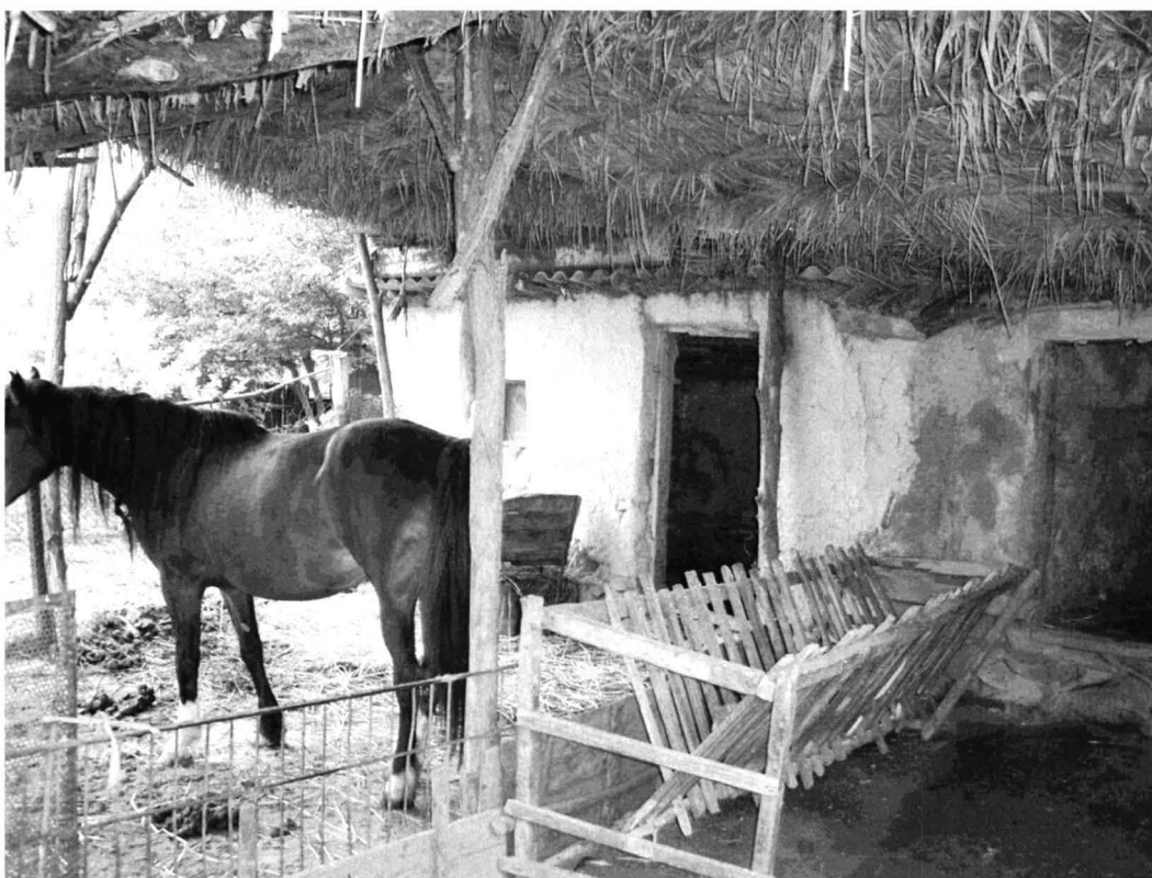
Grădina – imagini din gospodărie