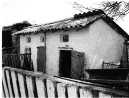
Tîrgușor – Case