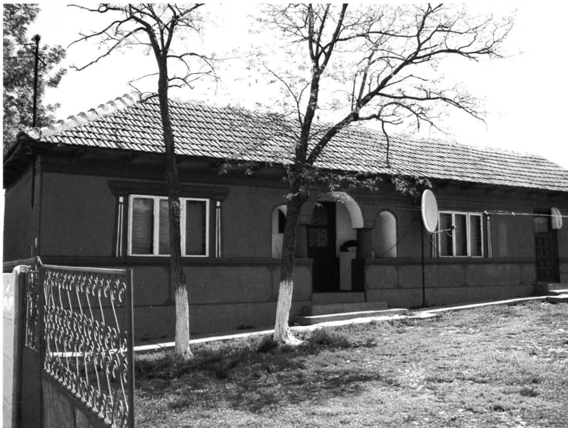
Tîrgușor – Casa nr.2