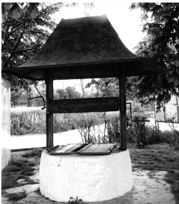
Tîrgușor – imagini din gospodărie