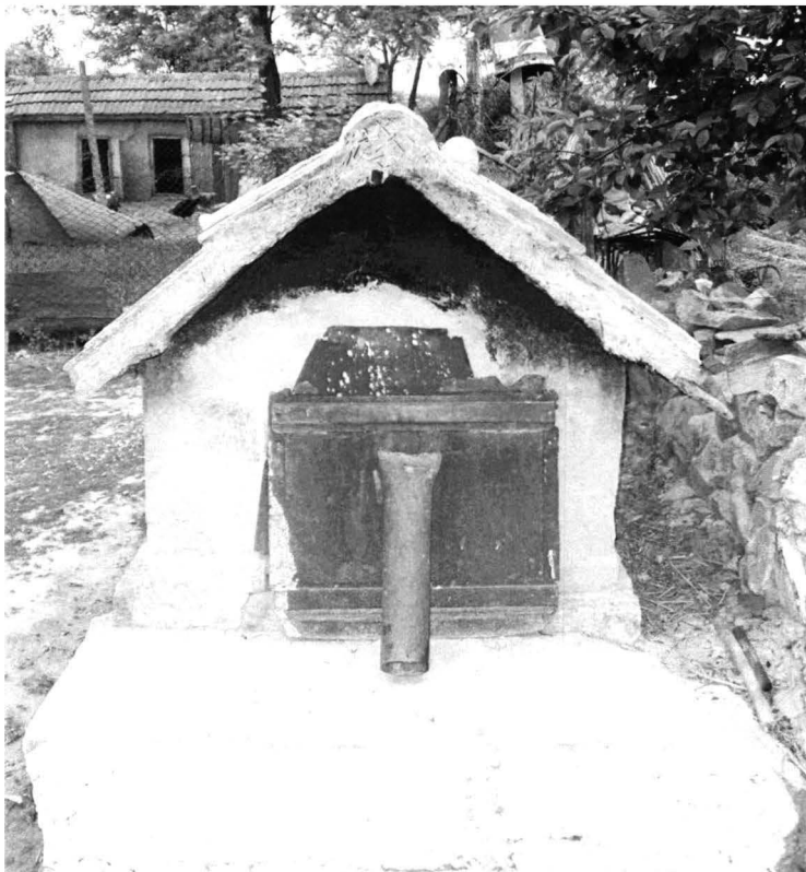
Tîrgușor – imagini din gospodărie